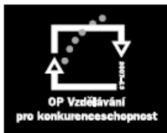
2 negativní bílešedá verze