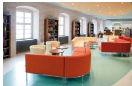
Součástí volného výběru knih jsou i pohodlné pohovky. Čtenář se může usadit a v klidu listovat publikací.

volného výběru knih není nijak omezen, jednotlivé svazky jsou totiž chráněny a prostory monitoruje kamerový systém. Čtenáři si mohou vyřídít půjčení literatury také bez pomoci knihovníka, a to díky samoobslužnému systému. Prolistované knihy, které si nechtějí odnést domů, nemusejí vracet zpět do regálů. To za ně udělá přítomný personál knihovny. Volný výběr knih prostě našim klientům nabízí maximální komfort,“ konstatuje Ivana Ho-