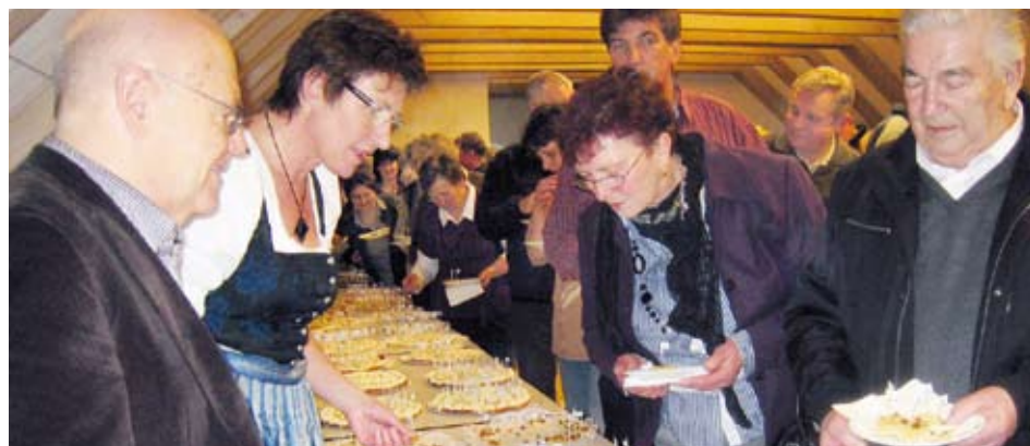
Centrum Bavaria Bohemia připravuje kulturní akce pro všechny generace. Velký úspěch měla například loňská soutěž v pečení koláčů chodského typu.

hemia, nejjednodušší je využít pravidelnou autobusovou linku společnosti DaTa-Expres, která vyjíždí na nejzajímavější akce střediska. Přehled veškerých aktivit centra v bavorském Schönsee je přehledně a dvojjazyčně zpracován na kulturním portálu www.bb.kult.net . ■