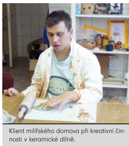
Klient milířského domova při kreativní činnosti v keramické dílně.

Program činností v domově vychází z maximální podpory kreativity. Aktivní účast na tvo-