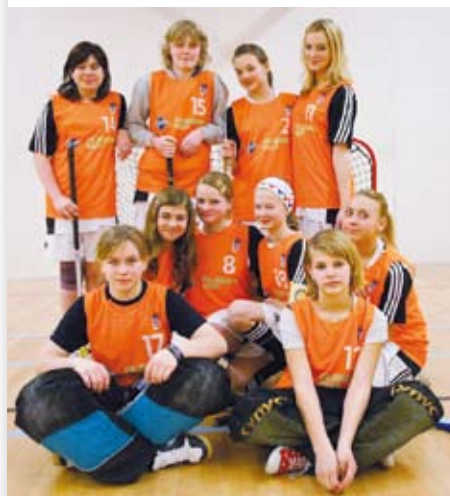
Florbalový tým mladších dívek Domu dětí a mládeže Stod obsadil ve své kategorii skvělé druhé místo.

Republikové finále Orion florbal cupu, ve kterém změřily síly týmy složené ze žáků základních škol a odpovídajících ročníků víceletých gymnázií, hostila v polovině února Městská sportovní hala v Plzni na Slovanech. Akci finančně podpořil Plzeňský kraj, záštitu nad ní převzal Jiří Struček, náměstek hejtmana pro oblasti školství, mládeže a sportu.