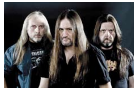
Thrash-metalová kapela Sodom.

Odpovědi zasílejte elektronicky na adresu redakce@plzensky-kraj.cz , a to do 4. dubna. Do předmětu mailu napište „Basinfirefest“. Po dvou vstupenkách získají tři soutěžící, jejichž správná odpověď bude doručena jako dvacátá, čtyřicátá a šedesátá v pořadí. Jména výherců zveřejníme v dubnovém vydání našeho měsíčníku. Pokud neznáte správnou odpověď na soutěžní otázku, najdete ji na adrese www.plzensky-kraj.cz . ■