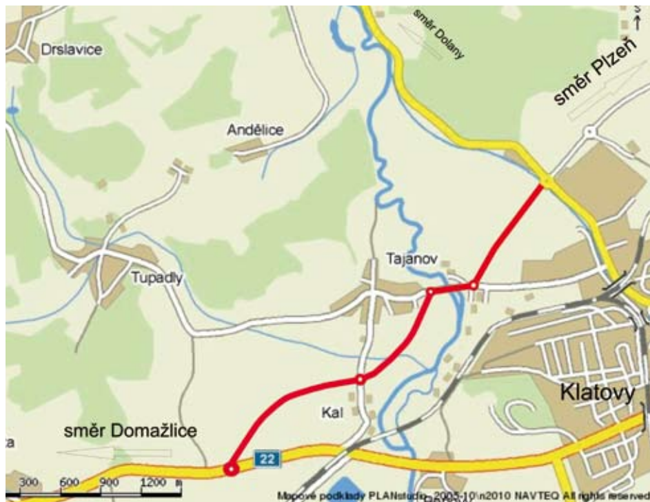
Takto vypadá druhá etapa severozápadního obchvatu Klatov, která spojí klatovskou Koldinovu ulici se silnicí I/22 nedaleko obce Kal.