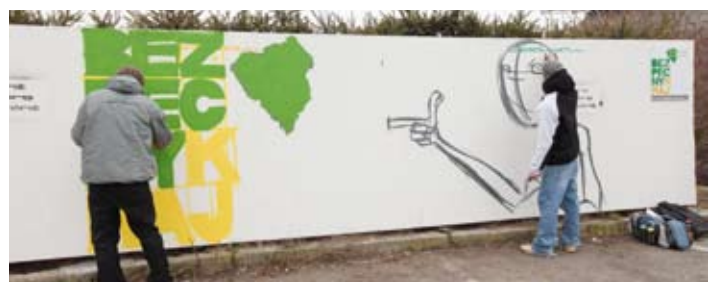
V Rokycanech byla v rámci projektu Plzeňský kraj – bezpečný kraj 4. března zprovozněna první legální sprejerská stěna. Mladí lidé si na ní mohou vyzkoušet malbu sprejem, aniž by páchali škodu na cizím majetku.