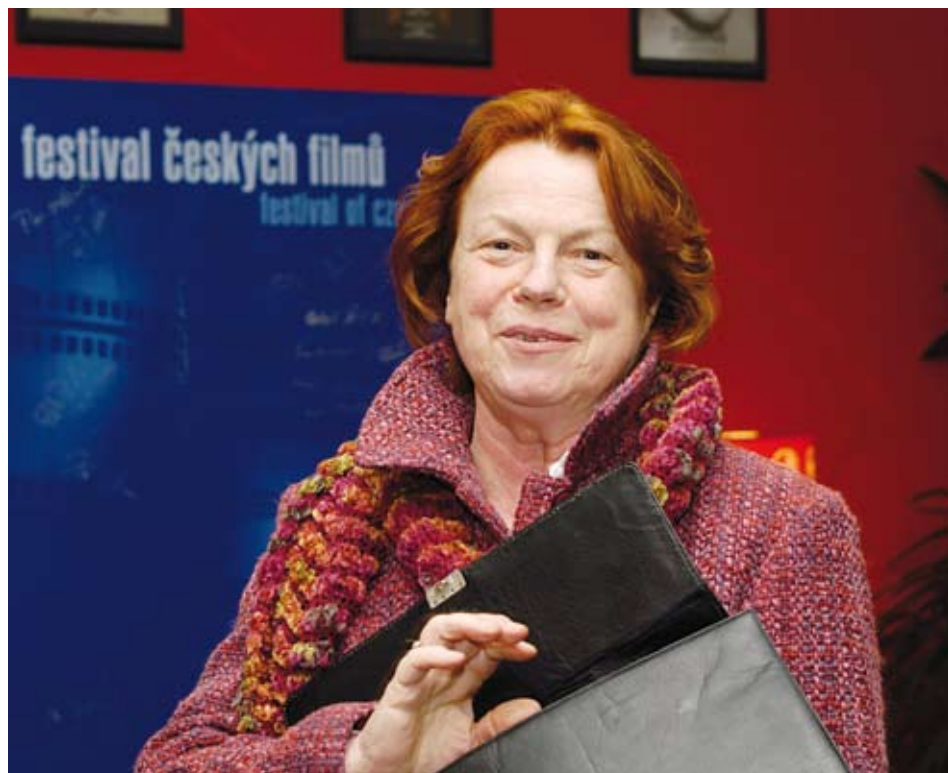
Hlavní pocta festivalu Finále bude letos patřit herečce Ivě Janžurové.

Slavnostní zakončení 24. ročníku Finále bude k vidění v sobotu 23. dubna v přímém přenosu na programu ČT2. Vstupenky na festival jsou k dostání v Měšťánské besedě a bližší informace najdete na www.filmfest-finale.cz .