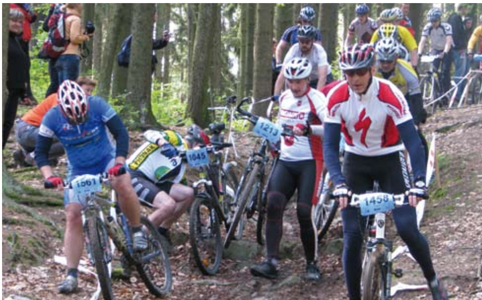
I letos povede trať ŠKODA BIKE marathonu náročným terénem, který důkladně prověří síly závodníků.

Převážnou část trati tvoří lesní a nebezpečné cesty. Start i cíl jsou stejně jako v předchozích letech v areálu Škoda sport parku v Malostranské ulici v Plzni na Slovanech. Atraktivní závodní trať vede například i okolím hradu Radyně a zámku Kozel či v blízkosti zříceniny hradu Lopata. Pro nejlepší závodníky jsou připraveny pětitisícové bonusy. V průběhu slavnostního vyhlášení bude ze startovních čísel losována tombola.