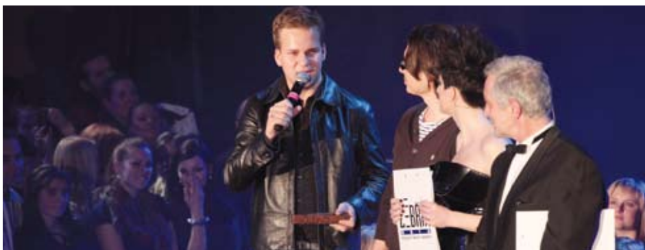
Pro ocenění Zpěvák roku si do Plzně přijel Martin Chodúr. Hudební anketu Žebřík má určitě rád – loni převzal cenu za vítězství v kategorii Objev roku.