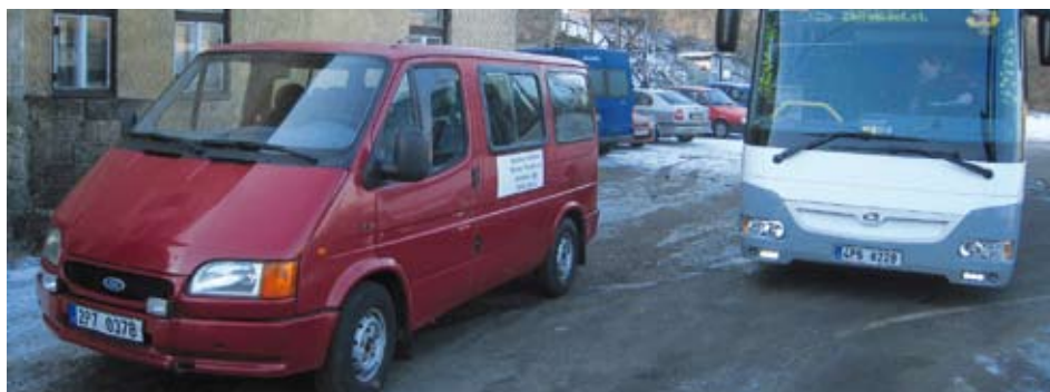
Po dvacáté hodině zajišťuje spojení mezi zbirožským náměstím a zhruba čtyři kilometry vzdálenou železniční stanicí minibus na zavolání (na snímku vlevo).

jsme se, že v méně exponovaných částech dne bude dopravce na trase mezi zbirožským náměstím a železniční stanicí nasazovat místo klasického autobusu minibus. Tím se ušetří určitý objem finančních prostředků, které pokryjí provoz pozdně večerních spojů na zavolání,“ vysvětluje Marcela Benediktová. „Věříme, že s tímto novým druhem dopravy budou cestující maximálně spokojeni a nikdo jej nebude zneužívat. Pokud by docházelo k planým výjezdům, museli bychom situaci přehodnotit,“ dodává. ■