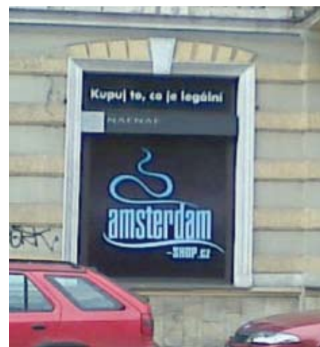
Prodejna nabízející psychotropní látky, která byla nedávno otevřena v Karlových Varech.

Plzeňské Centrum protidrogové prevence a terapie působí na území celého našeho regionu. Jeho pracovníci pomáhají lidem,