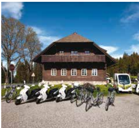
Půjčovna Chata Rovina.

V LOŇSKÉM ROCE BYLA 12. ČERVNA OTEVŘENA SÍŤ PŮJČOVEN ELEKTROKOL, ELEKTROSKÚTRŮ A ELEKTROMOBILŮ POD NÁZVEM E-ŠUMAVA.CZ NA CHATĚ ROVINA, KTERÁ SE NACHÁZÍ NAD DOBROU VODOU U HARTMANIC.