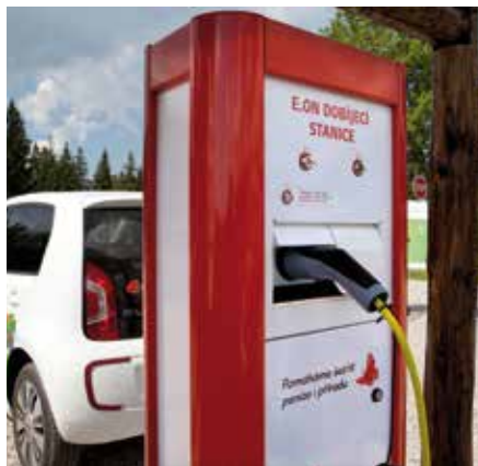
Dobíjecí stanice Chata Rovina.