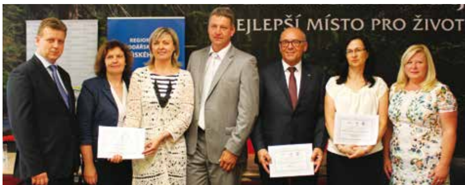
Společné foto zástupců oceněných firem v soutěži Cena hejtmána za společenskou odpovědnost za rok 2015.

Cenu hejtmána za společenskou odpovědnost pro rok 2015 získala společnost Systherm s.r.o., Gerresheimer Horsovsky Tyn spol. s r.o., Centrum pečovatelských a ošetrovatelských služeb Město Touškov a Statutární město Plzeň. Slavnostní vyhlášení se uskutečnilo 21. června na krajském úřadě.