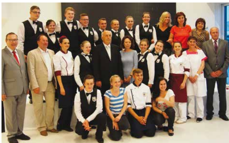
Společné foto studentů klatovské střední školy, kteří připravovali slavnostní raут.

Na recepci u příležitosti Českého pivního festivalu a Dne s Plzeňským krajem byl pozván monacký kníže Albert II. a další významné osobnosti Monaka. Na akci se kromě Plzeňského kraje prezentovaly české pivovary nabízející ochutnávku českých druhů piv. Recepce zahájila velvyslankyně ČR ve Francii. Za jejího doprovodu a za přítomnosti hejtmana Václava Šlajse si poté monacký kníže Albert II. prohlédl stánky českých pivovarů a především ochutnal česká piva. Atmosféru recepce skvěle dopl-