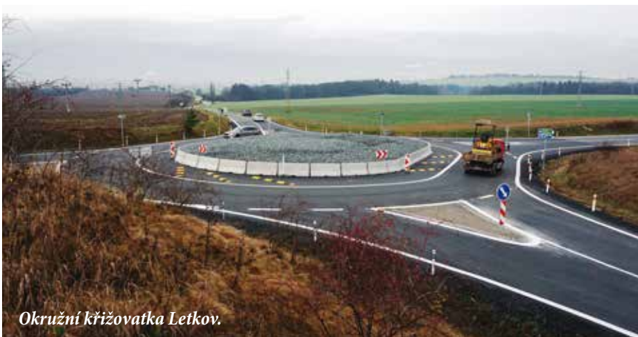
Okružní křižovatka Letkov.

Nebezpečných úseků s výskytem častých dopravních nehod máme v kraji samozřejmě více. Tuto situaci řešíme postupně ve spolupráci s Dopravním inspektorem Policie ČR. I v letošním roce Rada Plzeňského kraje uvolnila významné finanční prostředky Správě a údržbě silnic PK na jejich postupné odstraňování.