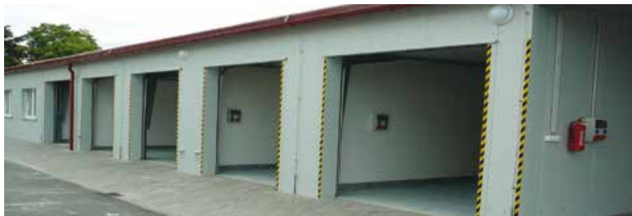
Sklad Správy a údržby silnic Plzeňského kraje ve Stříbře.

V poslední době jsme získali objekt pro Západočeské muzeum ve Zborovské ulici v Plzni, a to bezúplatně od města Plzně s ohledem na vložené investice do tohoto objektu, převzali jsme bezúplatně objekt hvězdárny od města Plzně, směnou s doplatkem s městem Plasy jsme získali objekty pro naše Gymnázium a SOŠ Plasy. To je jen za poslední dobu. Také mě potěšilo, když jsme sečetli kolik pozemků pod silnicemi II. a III. tříd se nám podařilo získat za roky 2013–2015 a 1. pololetí 2016 – činí to 1 877 tisíc m 2 . Za vším, co jsem jen příkladem uvedla, je kus poctivé