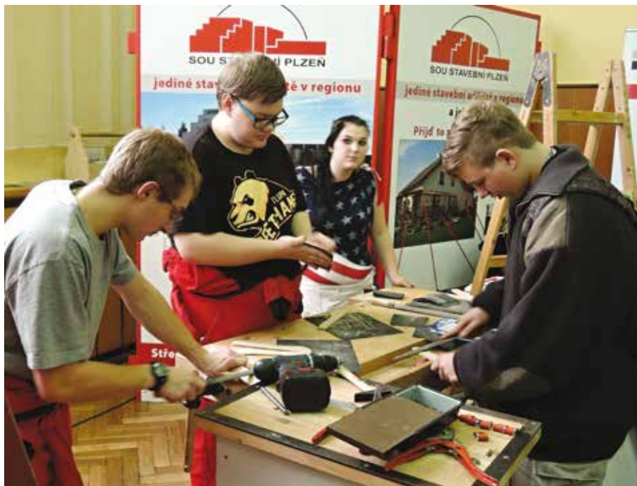
Veletrh perspektivy řemesel se uskutečnil ve Stodě.

propagační materiály a letáčky jednotlivých škol s nabídkou oborů, termíny Dnů otevřených dveří a dalšími potřebnými informacemi.