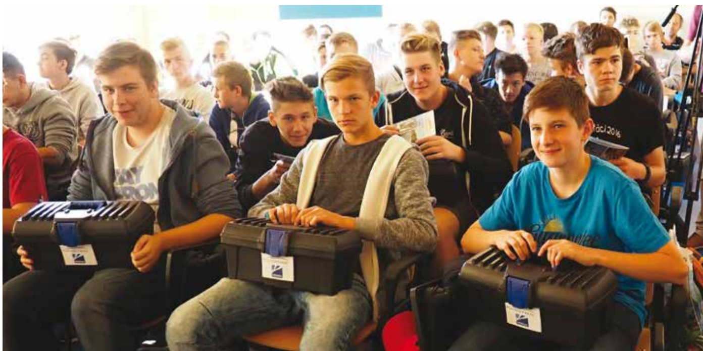
Kufříky převzali žáci prvních ročníků Střední průmyslové školy strojnické a Střední odborné školy prof. Švejcara v Plzni.