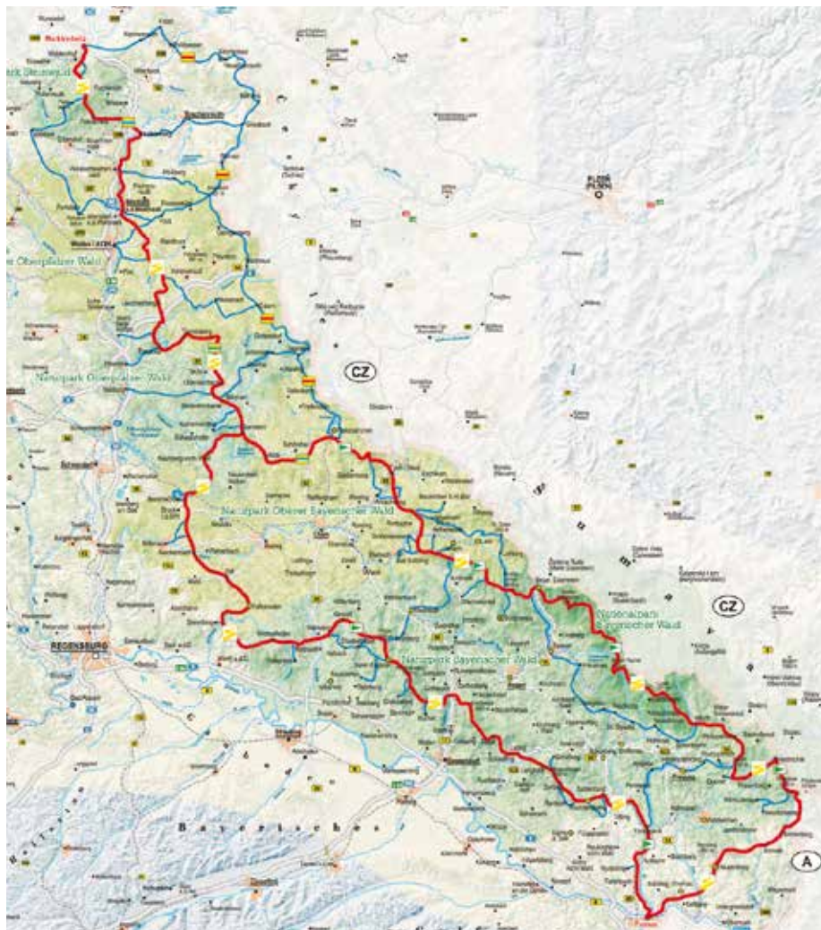
Vyznačení trasy Zlaté stezky podél hranic na německé straně.

Takto vzniklá přeshraniční síť cest vytvoří základnu pro zesílenou mezinárodní orientaci turistického regionu Východní Bavorsko – Plzeňský a Jihočeský kraj skrze ojedinělou přírodu hlubokých lesů, malebných kopců a rozmanité fauny a flóry. V Bavorsku se Zlatá stezka těší obrovské popularitě a do budoucna lze nadále očekávat velký zájem o domácí cestovní ruch i o pěší turistiku jako takovou. Z hlediska popptávky se jedná o projekt s perfektním načasováním. Projekt, jehož realizaci letos zahájil Plzeňský kraj, je plánovaný na 3 roky, bude završen v roce 2019 a přinese zcela jistě mnoho skvělých zážitků všem cestovatelům a turistům.