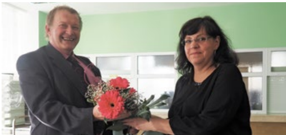
V domově seniorů Panorama v Tachově přivítala ministryně radní Zdeněk Honz (ČSSD).

Jednou ze zastávek na pracovní cestě ministryně práce a sociálních věcí ČR Michaely Marksové-Tominové na Tachovsku v pátek 27. února 2015 byl Domov seniorů Panorama v Tachově zřizovaný Plzeňským krajem. Zde se společně s náměstkem hejtmána Jiřím Stručkem a radním pro sociální věci Zdeňkem Honzem zúčastnila diskuse se seniory.