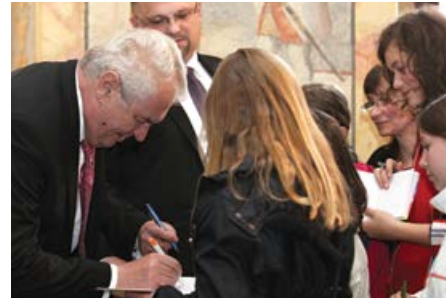
Na podpis prezidenta se stály fronty.