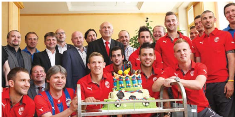
Přijetí fotbalistů Viktoria Plzeň na krajském úřadě.