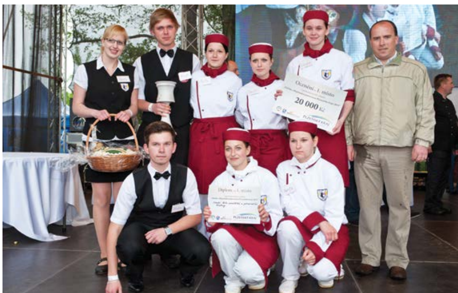
Vítězný tým studentů Střední školy zemědělské a potravinářské, Klatovy.