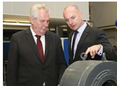
Návštěva společnosti Škoda Transportation.