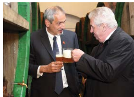
Návštěva pivovaru Plzeňský Prazdroj.