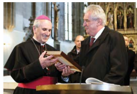
Setkání s plzeňským biskupem.