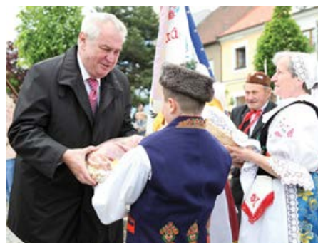
Privítání prezidenta v Přeštichách.