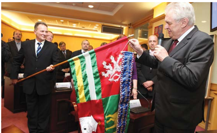
Na krajském úřadě dekoroval Miloš Zeman vlajku kraje prezidentskou stuhou.