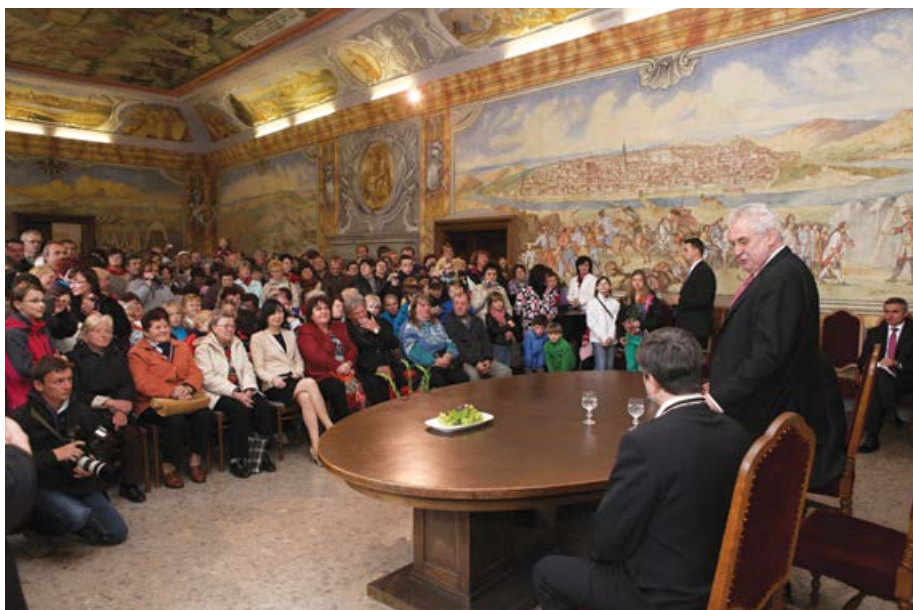
Jedno ze sedmi setkání s občany se uskutečnilo na Městském úřadě v Horažďovicích.