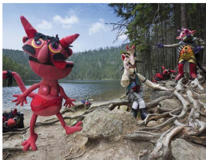
Čerti se zabydleli na Čertově jezeře.