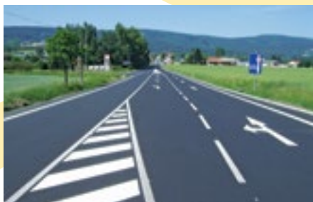
Nový povrch dostala silnice mezi Klenčí a Draženovem.