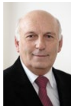
Václav Šlajs hejtman Plzeňského kraje