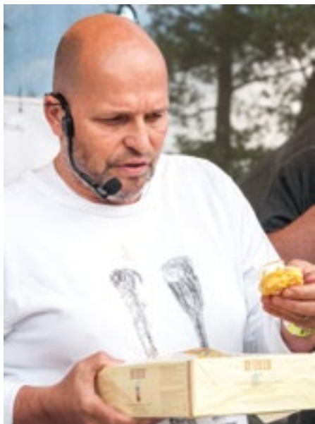
Zdeněk Pohlreich zaujal diváky loňského ročníku Apetit Festivalu. Chybět nebude ani letos.

Svátek dobrého jídla a pití Apetit Festival se letos uskuteční v termínu 17. až 18. května za OC Plzeň Plaza a ani tento