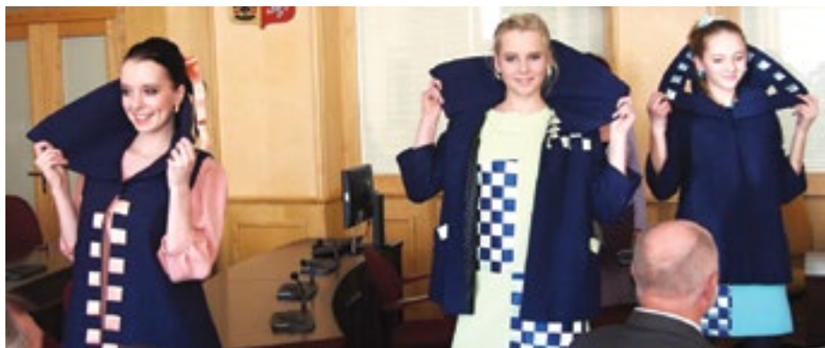
Oceňování pedagogů zpestřila módní přehlídka výtvořů žákyň ISSŽ Plzeň.