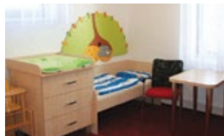
Pokoj pro matku a dítě je vybaven lůžky, základním nábytkem, ale také kuchyňským koutem a sprchou.

ciálně právní ochrany dítěte. S matkou je pak uzavřena písemná dohoda o přijetí,“ doplňuje ředitelka Tichá s tím, že služba samozřejmě zahrnuje nezbytnou lékařskou a ošetrovatelskou péči odpovídající zdravotnímu stavu dítěte.