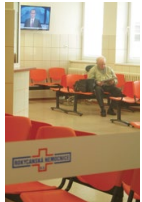
Čekárna společného příjmu je vybavena mimo jiné televizními obrazovkami.