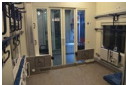
Prostor pro umístění vozíčků, dětských kočárků nebo jízdních kol ve vlaku Regio-shark.

Spoje, na kterých jsou nasazována nízkopodlažní vozidla, jsou v jízdním