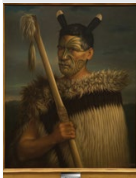
Gottfried Lindauer, Rewi Manga Maniapoto, 1882. (Auckland Art Gallery Toi o Tāmaki, dar Henryho E. Partridge, 1915)

Kromě toho výstava představí profil malíře v celé šíři i z českých státních, církevních a soukromých sbírek. Gottfried Lindauer patří mezi autory s mimořádně zajímavým osudem. V roce 1874 odešel na Nový Zéland, kde proslul jako vynikající malíř původního maorského etnika a v dnešní době je zde považován za jednoho z nejpopsanějších umělců tzv. koloniálního období.