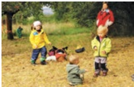
Luční školka Prusiny v Nebíloveh.

ti dnešních dětí. Proto mne dost mrzí, že Plzeňský kraj, který byl hodnocen mezi kraji jako „nejlepší místo pro život“ je v tomto případě hodnocen spíše mezi kraji horšími. To stojí určitě za zamyšlení. A co je nejvíc překvapující, je to, že městské děti jsou na tom lépe než venkovské. Vysvětlují si to tím, že i když se obecně stírá rozdíl mezi dětmi ve městech a na venkově, ty městské mají k dispozici přeci jenom více sportovních kroužků a možností jiného