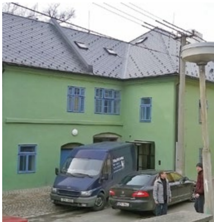
Stavba po rekonstrukci.