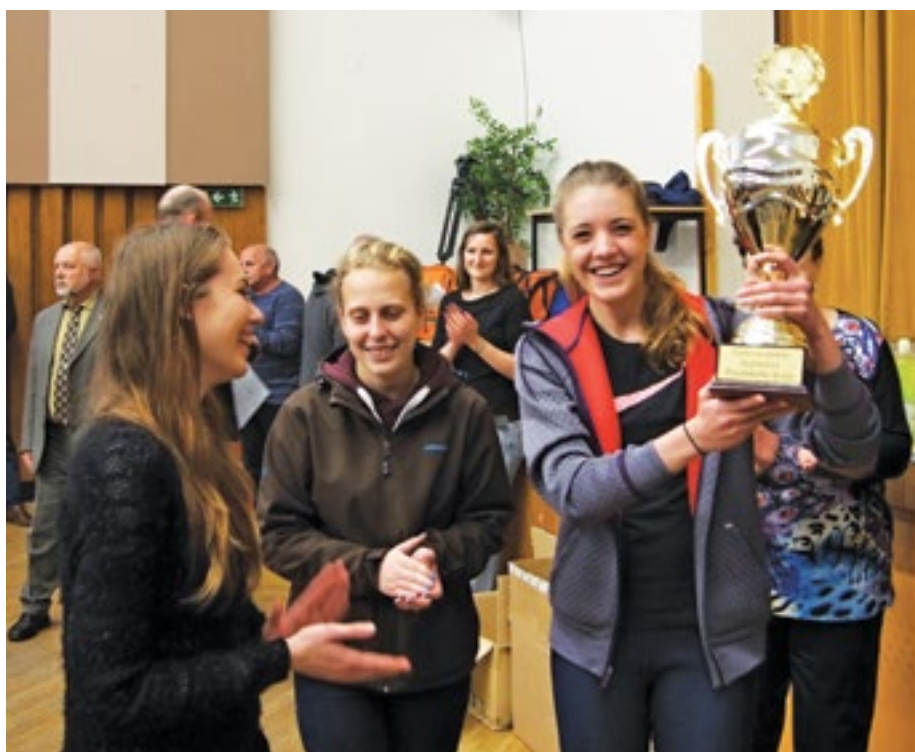
Putovní Pohár hejtmána Plzeňského kraje zůstává na Sportovním gymnáziumu.