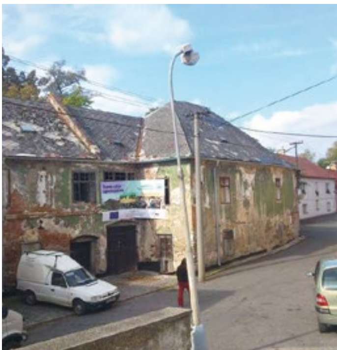
Podbranský mlýn před rekonstrukcí.

Region pravidelně navštěvuji a sleduji realizaci projektů na místě. V poslední době mne velmi zaujal zrekonstruovaný Podbranský mlýn v Horažďovicích, který bude sloužit jako environmentální centrum pro žáky a studenty z Čech a Bavorska. Na opravu stovky let starého mlýna získal kraj dotaci ze společného česko-bavorského přeshraničního programu Cíl 3.