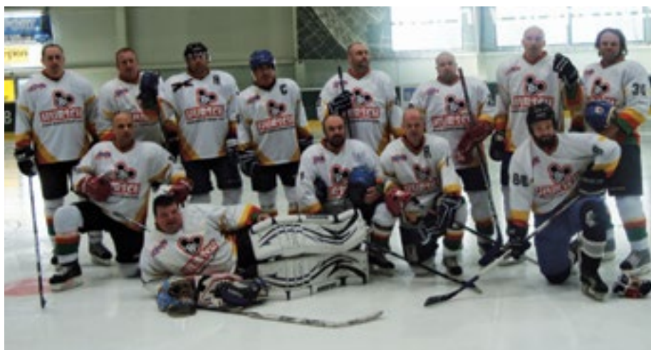
Vítězný tým záchránářů z Plzeňského kraje.