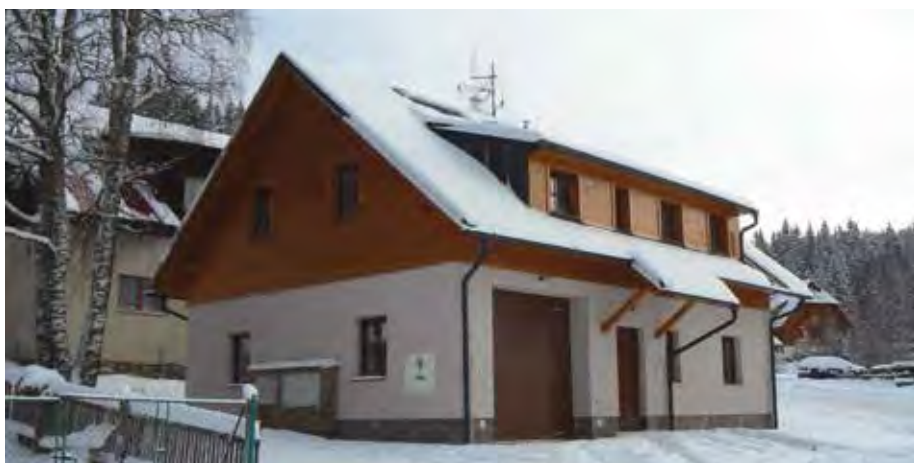
Nové stanoviště ZZS PK na Modravě začalo sloužit obyvatelům i turistům 5. ledna 2015.

Díky výstavbě nového výjezdového stanoviště na Modravě se rychlá zdravotnická pomoc obyvatelům této části Šumavy a také turistům dostane dříve. „Výjezdová skupina ZZS PK je tvořena dvoučlennou nelékařskou výjezdovou skupinou ve složení záchranář/sestra a řidič. Tato výjezdová skupina bude mít k dispozici velké sanitní vozidlo. Lékař pro oblast Modravská bude dostupný v malém sanitním vozidle v tzv. rendez-vous systému z výjezdového stanoviště v Klatovech nebo ve velkém sanitním vozidle z výjezdového střediska v Sušici. Mám velkou radost z toho, že v oblasti Modravu bude zajištěna péče všeobecně dostupná, vysoce odborná, odpovídající standardním evropským po-