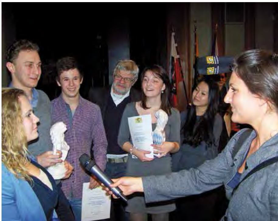
Po získání ocenění čekaly na studenty rozhovory pro německou televizi a rozhlas. Interview se studenty obou gymnázií provázela uvolněná atmosféra.

V závěru slavnostního shromáždění byli představeni a oceněni nejúspěšnější účastníci soutěže školních uměleckých projektů nazvané "Překonání hranic". Prestižní první cenu z této soutěže zaštitěné osobně ministerským předsedou Horstem Seehoferem získal dvouletý historický a divadelní projekt Gymnázia Wernera von Siemens v Regensburgu a Gymnázia J. Š. Baara věnovaný historii pohraniční obce Folmava. Jeho výsledkem byla česká a německá verze brožury a putovní výstavy shrnující získané poznatky a dvojjazyčné studentské divadelní představení, jehož scénář inspirovaly reálné lidské osudy, s nimiž se studenti seznámili během první etapy tohoto projektu.