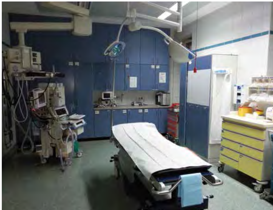
Lékařky absolvovaly část stáže na urgentním příjmu jedné z klinik společnosti Sana Kliniken AG.