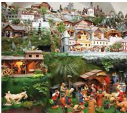
Jeden z největších betlémů v ČR najdete v muzeu v Sušici.