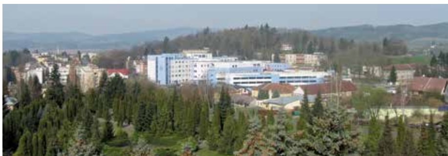
Dva bloky výstavy porovnávají historickou a současnou podobu nemocnice – například pohled na Křesťanský vršek.