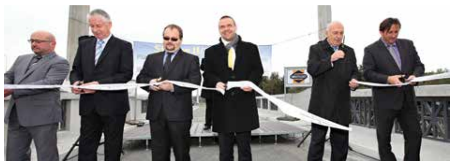
Slavnostní stříhání pásky.

v délce 450 m včetně 630 m dlouhé nové přeložky části komunikace přes areál bývalé ČOV, jejíž hlavní součástí je i nový most přes řeku Berouнку. Nově jako stezka pro pěší i cyklisty nyní slouží zrekonstruovaný historický železobetonový obloukový Masarykův most.