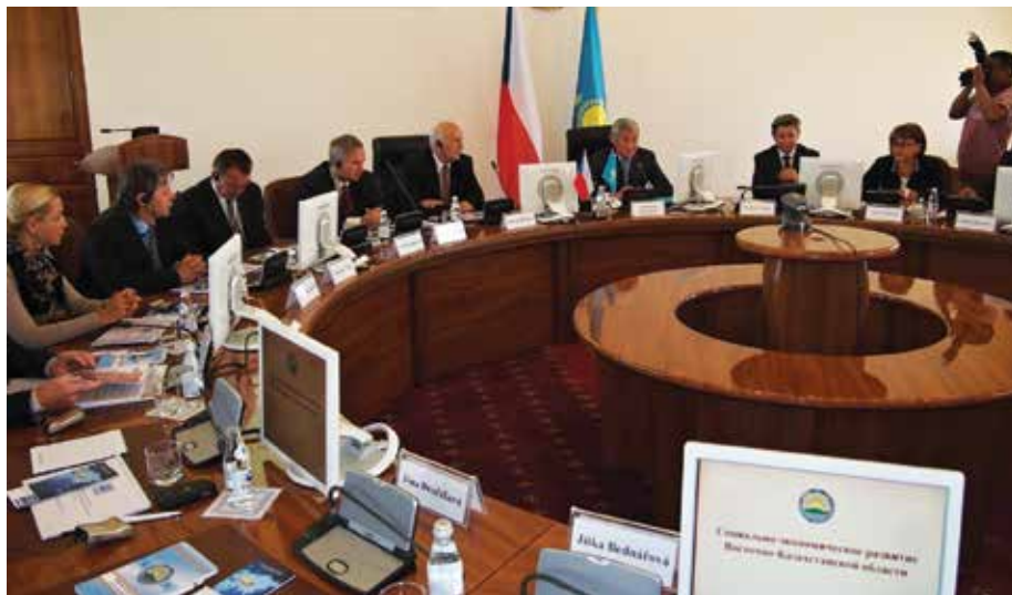
Jednání s podnikateli u kulatého stolu ve městě Ust'-Kamenogorsk.

Neblahá situace Ruska a Ukrajiny v současné době také vede k tomu, že se hledají náhrady za blokové ruské trhy a Kazachstán je jednou z nich. Mám proto radost, že naše spolupráce s hejt-