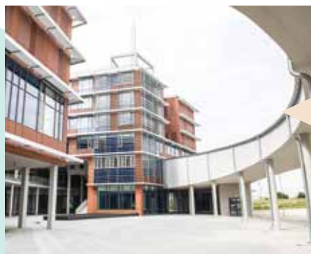
Evropské centrum excelence NTIS – Nové technologie pro informační spo-

lečnost, vybudované z operačního programu Výzkum a vývoj pro inovace, bylo slavnostně otevřeno 19. září. Ve špičkových laboratořích vybavených unikátními přístroji najdou zázemí odborníci orientovaní na kybernetiku, informatiku, mechaniku, fyziku a matematiku. Druhé křídlo budovy, které je určeno zejména pro výuku přírodovědných oborů, bylo postaveno v rámci projektu Centrum technického a přírodovědného vzdělávání a výzkumu. Na ploše o rozloze bezmála 23 tisíc m 2 bude pracovat téměř pět stovek zaměstnanců.