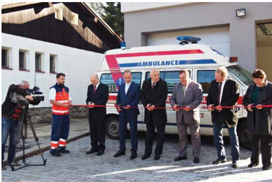
Přestížením pásky bylo nové výjezdové stanoviště záchranářů v Železné Rudě slavnostně uvedeno do provozu.