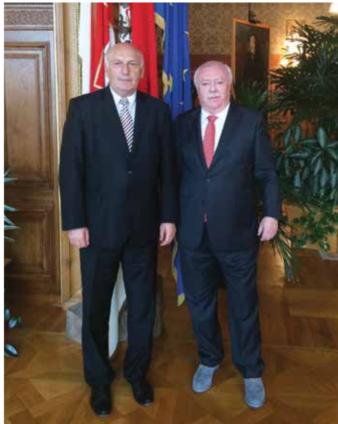
Na vídeňské radnici hejtmána přijal starosta Vídně Michael Häupl.