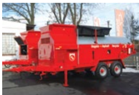
Recyklátor Bagela mají nově k dispozici silničáři v Plzeňském kraji.

Středisko specializovaných činností stříbrských silničářů připravuje pro starosty obcí a další zájemce na jaro i předváděcí akci, na níž ukáže přímo v provozu nová zařízení, která mají k dispozici. Jedna z Bagel tam určitě nebude chybět.