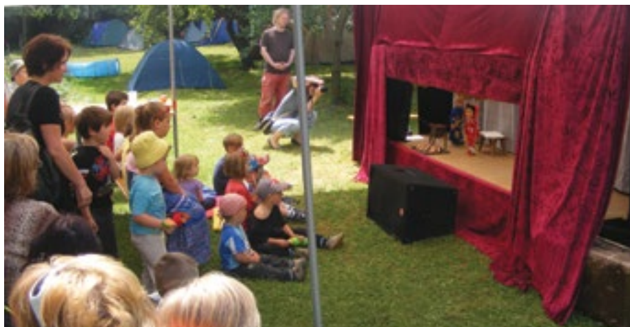
V rámci projektu EHMK 2015 se vloni uskutečnily v Centru klášter Chotěšov 5. Chotěšovské zahradní slavnosti.

Plzeňský kraj vyhlásil v souladu s přijatým Memorandem o spolupráci Plzeňského kraje a statutárního města Plzeň při realizaci projektu Plzeň – Evropské hlavní město kultury 2015 Pravidla pro poskytování finanční podpory Plzeňského kraje nositelům projektů EHMK pro roky 2014–2015. „V letošním roce budou v rámci 1. výzvy podpořeny víceleté stěžejní projekty, zejména Západočeské baroko, a projekty naplňující regionální program EHMK, které budou zahájeny v roce 2014 a budou probíhat i v roce 2015. Ve schváleném rozpočtu Plzeňského kraje na rok 2014 je pro tuto podporu vyčleněna částka ve výši 6 milionů korun,“ uvedl náměstek hejtmána pro oblast školství, sportu, kultury a cestovního ruchu Jiří Struček.