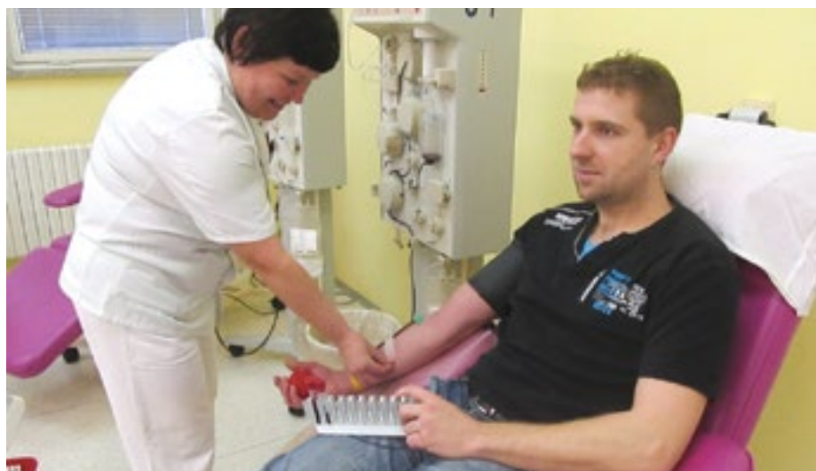
Transfuzní oddělení Klatovské nemocnice provádí i odběr plazmy.