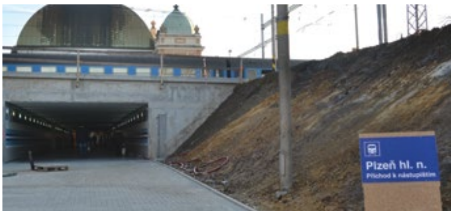
Nový bezbariérový podchod z budovy Hlavního nádraží do Šumavské ulice.

Velký přínos pro cestující znamenalo otevření nového podchodu spojujícího plzeňské hlavní vlakové nádraží s Šumavskou ulicí. Cestující se tak bezbariérově a rychleji dostanou k zastávkám tramvají č. 1 a 2 a většině trolejbusových linek. Rovněž se zjednodušil přestup na linky příměstské dopravy, na jejichž vybraných spojích je stále častěji možné využít částečně nízkopodlažní autobusy. I na železnici se rozšířil počet spojů obsluhovaných částečně nízkopodlažními jednotkami RegioShark (vybrané spoje na tratích 180 a 160). Spoje, které jsou zajišťovány nízkopodlažními nebo částečně nízkopodlažními vozidly, lze v jízdních řádech poznat dle ikony vozíčkáře.