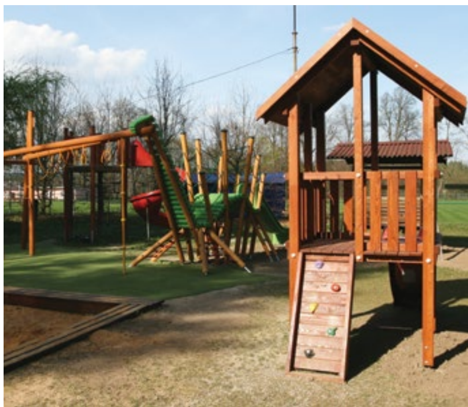
Obec Druztová má díky dotacím nově rekonstruované dětské hřiště.

Další částí tohoto programu je podpora obcí při tvorbě nového územního plánu. Do letošního roku přispěl kraj z PSOV na tvorbu územního plánu už 211 obcím.