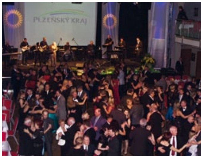
Vyprodaný sál plzeňského Parkhotelu tančil v rytmu českých i světových hitů v podání orchestru OKiii Band.