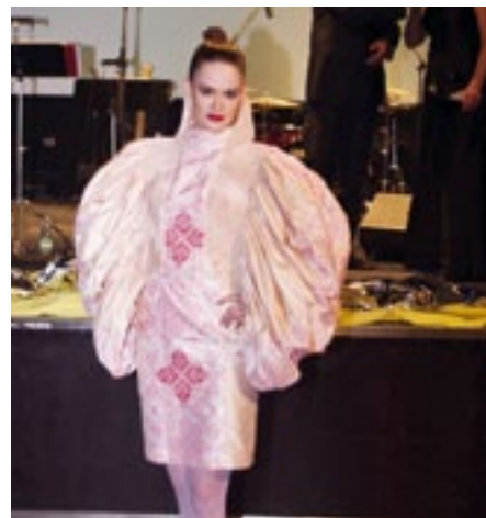
Modelka předvádí dražené šaty vytvořené žáky ÚUD ZČU v Plzni.