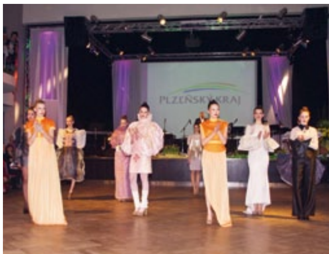
Módní přehlídka modelů vytvořených žáky Ústavu umění a designu v Plzni předcházela vrcholu večera, kterým byla dražba šatů právě z této dílny.