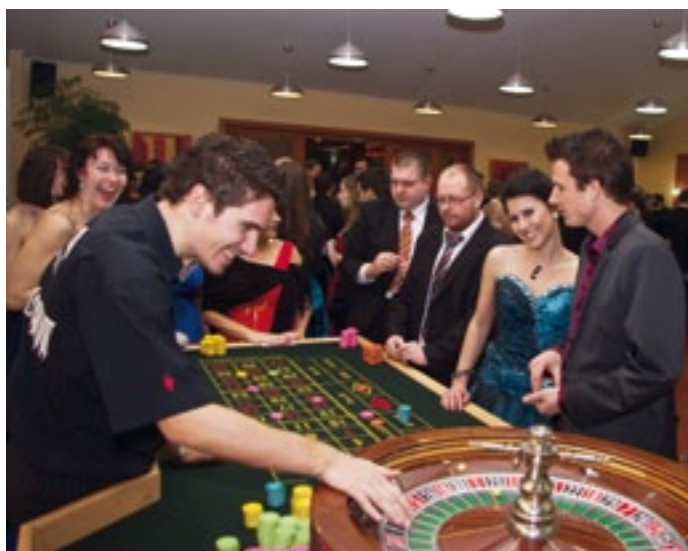
Každý návštěvník plesu dostal při vstupu deset tisíc „plesových“ korun, které mohl zúročit v mobilním casinu v malém sále Emporio.