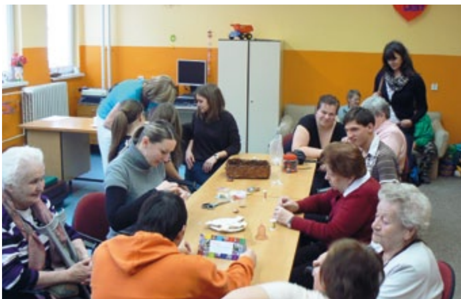
Tvůrčí dílny při ukázce techniky drátkování.