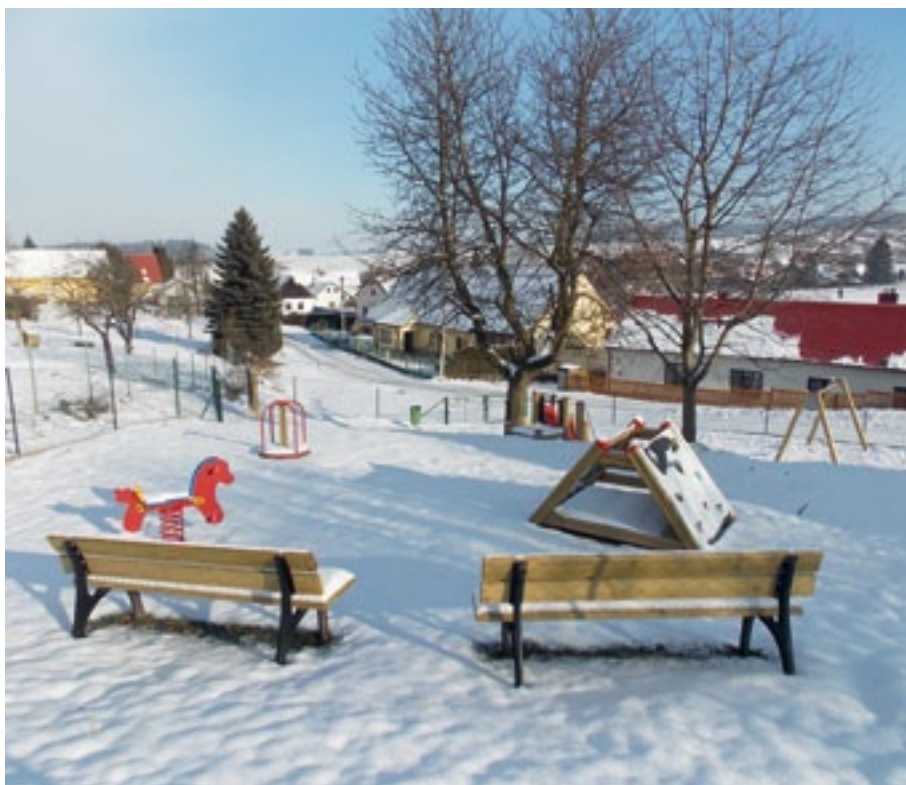
Jedním z realizovaných projektů z programu PSOV PK je například dětské hřiště v Myslovicích.

Žádost musí být podána elektronicky prostřednictvím aplikace eDotace. Žádosti je možné podávat v termínu od 4. února do 5. dubna 2013. Postup přihlášení, vytvoření účtu, zpracování a podání žádosti je ke stažení na úvodní stránce aplikace eDotace - dokument „eDotace - Jak zadat žádost do aplikace v PDF.