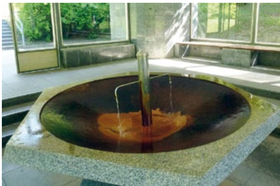
Prusíkuv pramen v Konstantinových Lázních.

„Cílem dotačního programu je podpořit další vzdělávání lékařů a zvyšování jejich kvalifikace. Nově získané zkušenosti lékařů ze zahraničních stáží tak přispějí ke zvyšování úrovně a kvality péče lékařů v kraji,“ říká krajský radní pro zdravotnictví Václav Šimánek.