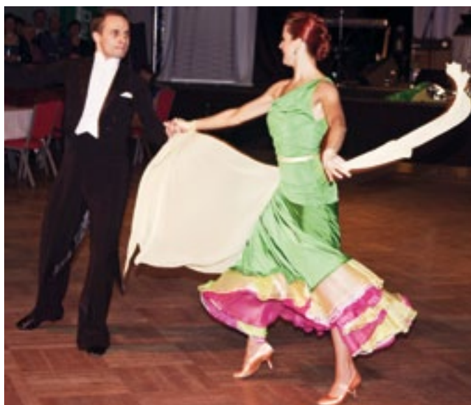
V úvodu plesu své umění předvedli tanečníci z klubu Lions Dance.