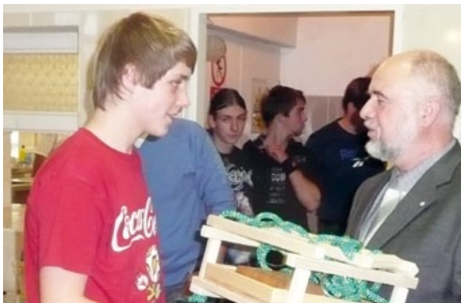
Slavnostní ukončení a vyhodnocení motivačního programu se uskutečnilo na Střední škole Oselce.

Právě v Oselcích se 19. února uskutečnilo slavnostní ukončení a vyhodnocení motivačního programu. Výsledky práce 25 žáků ze 2 zájmových kroužků vzbudily zájem všech účastníků. Kromě žáků, zástupců škol a hostů přišli také rodiče žáků.