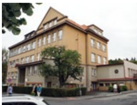
Budova Střední průmyslové školy strojnické v Klatovech.

Po dlouhodobých jednáních, která mezi Plzeňským krajem a městem Klatovy začala již v r. 2009, se dobrá věc podařila. Plzeňský kraj a město Klatovy uzavřelo smlouvu o směně několika objektů kraje na území města Klatovy za budovu školy ve vlastnictví města Klatovy. Směňované objekty byly převážně nadbytečné a nevyužívané pro potřeby kraje a jeho organizací. V jednom případě, pro potřebu muzejního depozitáře, pak přispělo k řešení i uvolnění objektů v původní „staré“ klatovské nemocnici. Získáním