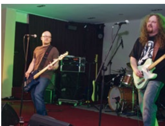
Večer v sále Conferenza byl zahájen diskotékou, po které následovalo vystoupení kapely Lucie revival. Po půlnoci pak zde probíhala oldies diskotéka.