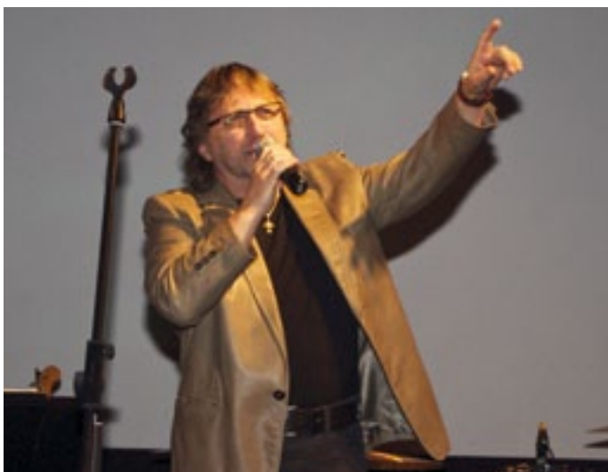
Spolu s Daliborem Jandou si plný sál zazpíval jeho největší hity a nechyběl ani Hurikán.