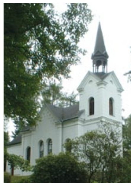
Kostel Panny Marie Lourdské v Konstantinových Lázních

Přestože Konstantinovy Lázně leží jen 35 kilometrů severozápadně od Plzně, poskytují klidný pobyt mezi lesy a přírodními rezervacemi. Přírodním léčivým zdrojem je minerální voda s nejvyšším obsahem volného oxidu uhličitého v ČR. Je vhodná pro léčbu kardiovaskulárních chorob a dále právě pro nemoci nervové a pohybové soustavy. Lázeňské domy disponují 350 lůžky.