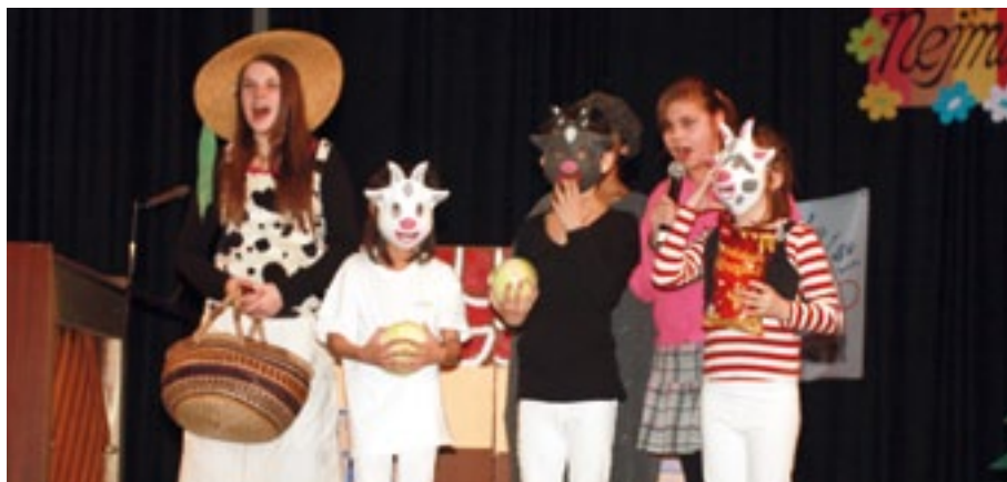
Děti z dětských domovů Plzeňského kraje obsadily v deseti soutěžních kategoriích sedm prvních míst, pět druhých míst a sedmkrát byly třetí.