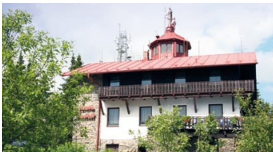
Vrchol Pancíře je jednou ze zastávek na trase pro pěší i cykloturisty.

Více informací na turistickém portálu www.turisturaj.cz .