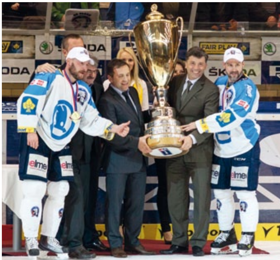
Slavnostní předávání extraligového poháru.

tější. Volal jsem rodičům, ženě, bráchovi a mluvil jsem se svým synem. Měl jsem na telefonu asi 1000 SMS.