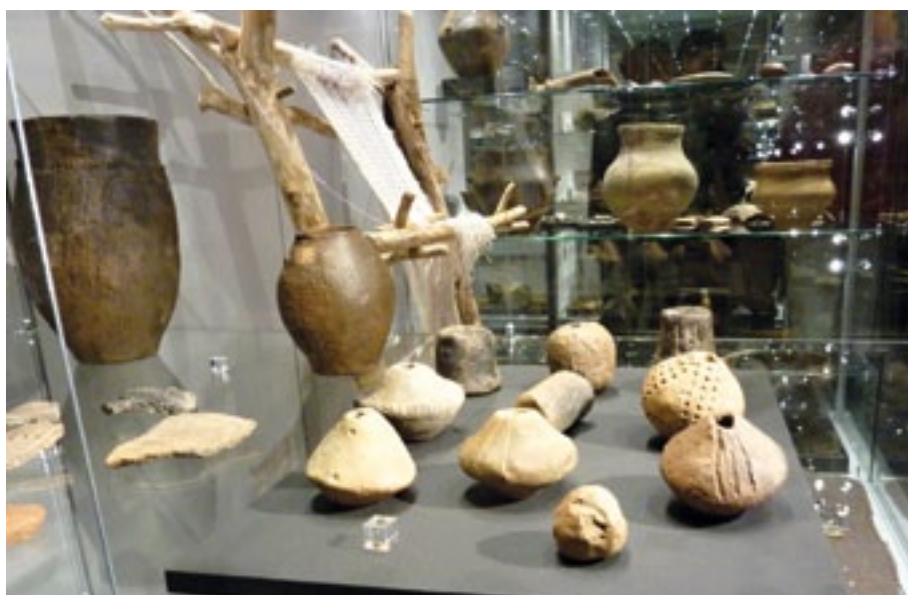
Expozice Archeologie nabízí pohled do pravěkého období osídlení jihozápadních Čech.