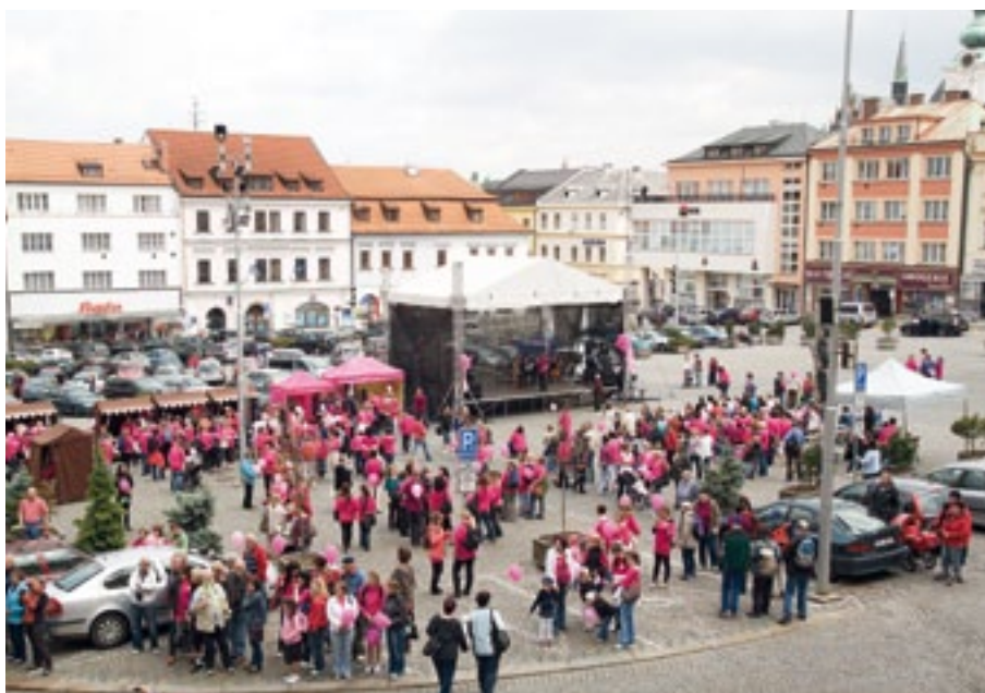
Účastníci Avon pochodu vloni zaplnili klatovské náměstí.