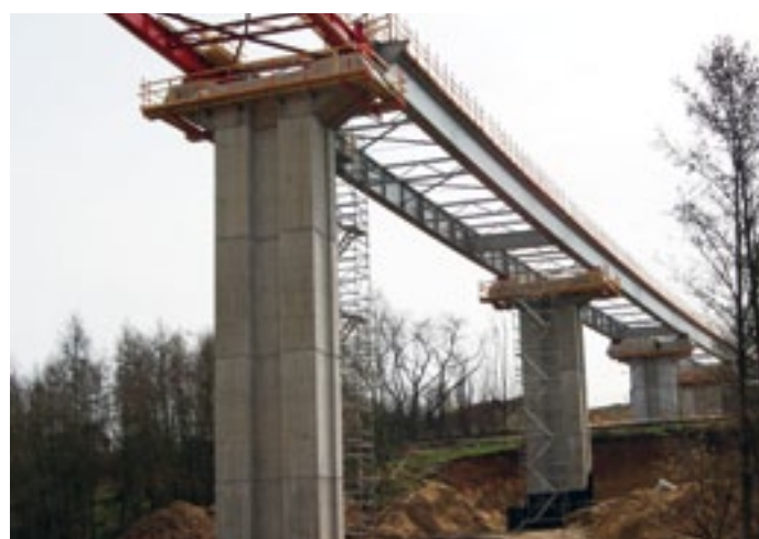
Celkově zhotovitel postavěl ke konci března 2013 204 mil. Kč, z toho 173 mil. Kč uhradil Plzeňský kraj a Správa a údržba silnic Plzeňského kraje.