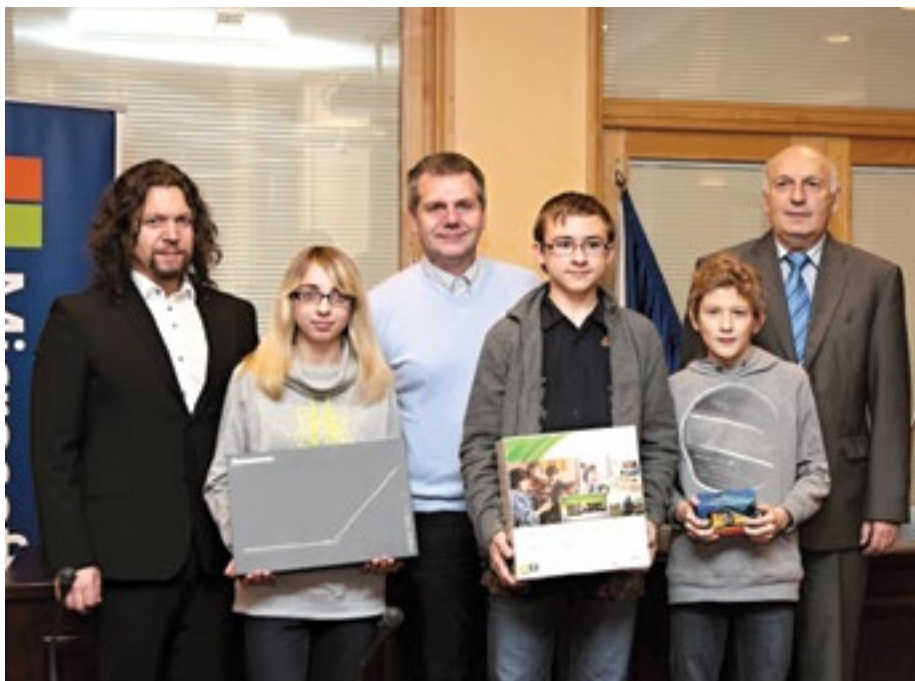
Společné foto žáků oceněných v programu eBezpečnost 2013.

se v roce 2013 věnoval nákupům prostřednictvím internetu