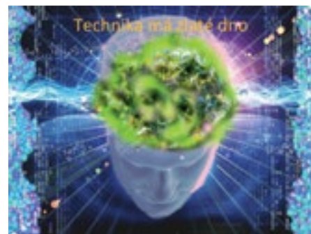
Grafický návrh přihlášený do soutěže Technika má zlaté dno.

stejně jako v případě rukodělné soutěže Řemeslo má zlaté dno, účastníků soutěže přibývat.