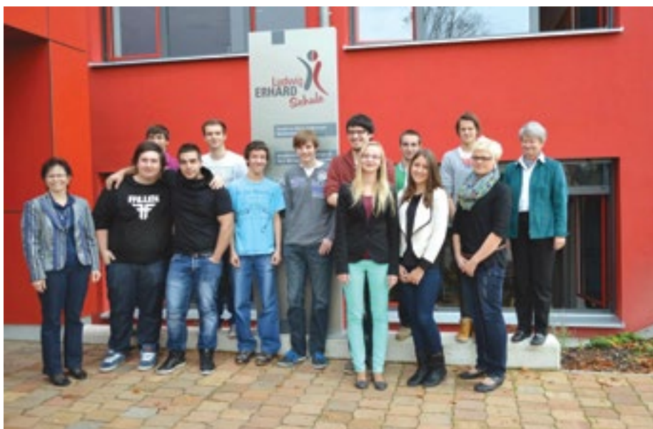
Společné foto českých studentů ze Střední školy informatiky a finančních služeb v Plzni a žáků partnerské školy ve Waldmünchenu.

Dvacet žáků Střední školy informatiky a finančních služeb v Plzni se zúčastnilo týdenního česko-německého workshopu Global Village v bavorském Waldmünchenu. Žáci 1. a 2. ročníku oboru Informační technologie a Logistické a finanční služby spolu s německými vrstevníky po celý týden soutěžili, diskutovali, pracovali v týmu nad dramatizací různých životních situací. Zpracovávali projekt zaměřený na mezikulturní vztahy s pomocí médií, testovali svoji fyzickou zdatnost v lanovém centru a trávili společně i volný čas. Aktivitu pro žáky připravili a vedli 4 lektori – dvě Češky a dva Němci.