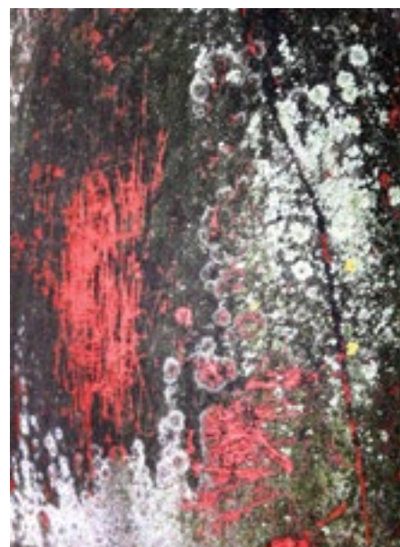
Ukázka z tvorby: Ohlas vášně.

Na adresu stávající výstavy Eva Hubatová uvedla: „Je pro mne velkou ctí, že mohu svojí tvorbou reprezentovat Plzeňský kraj v tak významné evropské metropoli, jakou je právě Brusel. Těší mě, že výstava má úspěch a z původního měsíce byla prodloužena až do ledna 2014.“