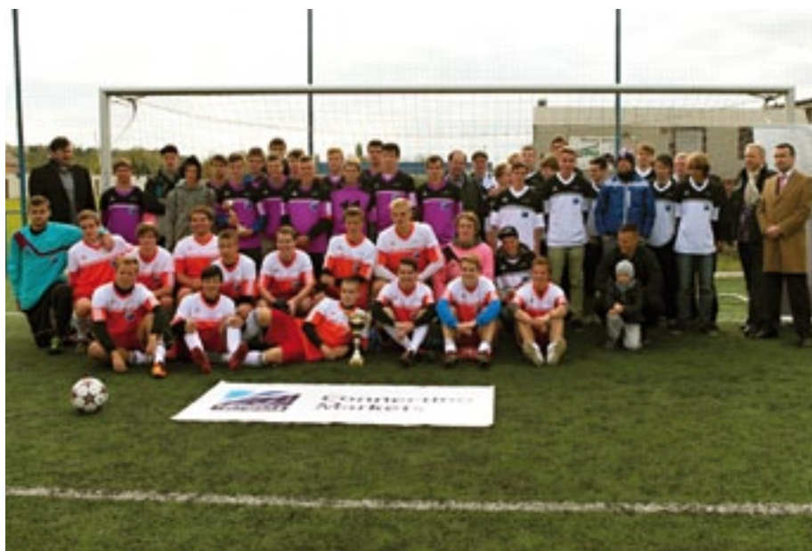
Společné foto účastníků fotbalového turnaje žáků středních škol Plzeňského kraje.

„Sportování mládeže podporujeme dlouhodobě a různými způsoby, ať je to