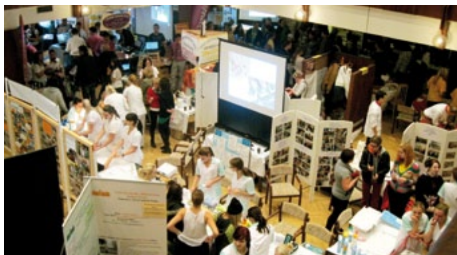
Organizátory potěšil velký zájem žáků základních škol o prezentační akce.

kulturní doprovodné programy, které si většinou připravují samotní žáci, a které prezentace vhodně doplňují. Tradičními se staly i různé ankety a soutěže připravené pro návštěvníky a zájemce o studium.