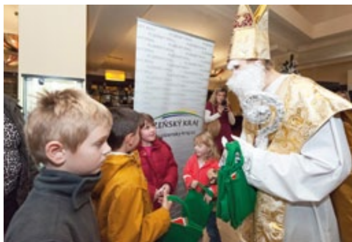
Na rozloučenou dostaly děti dárečky od Plzeňského kraje přímo z rukou Mikuláše.