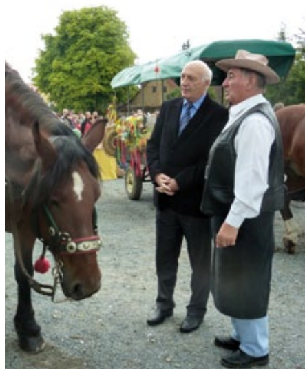
Václav Šlajs (ČSSD), 1. náměstek hejtmana před zahájením dožínkového průvodu.

Půl hodiny po poledni se Horní Břízou rozezněla folklorní muzika a nazdobené vozy zahájily dožínkový průvod, který se vydal společně se zástupci sdružení Vinaři Plzeňska ke hřišti u Sokolovny. Tady náměstek hejtmana Václav Šlajs převzal