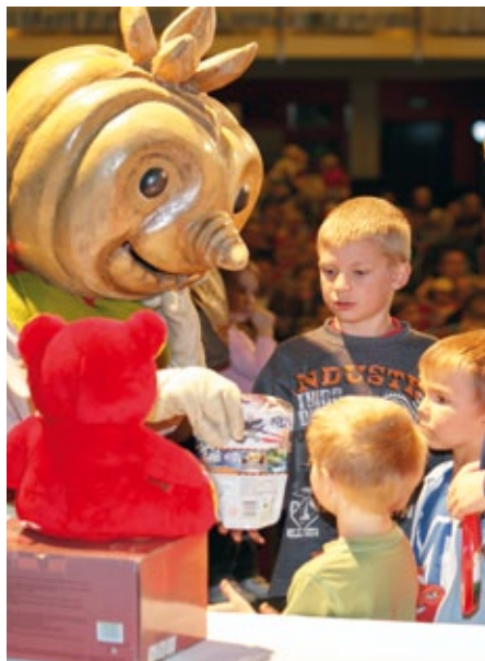
Děti za splnění soutěží čekala vždy nějaká odměna.

Bořek stavitel a jeho kamarádi přijeli v pondělí 7. října 2013 do plzeňského Parkhotelu pobavit dětské publikum. Dětská