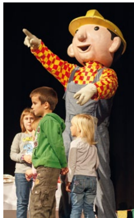
Bořek stavitel měl na pódiu spoustu pomocníků.

Sál byl plný dětí, které nadšeně přivítaly postavy v životní velikosti ze známého britského animovaného seriálu Bořek stavitel. Ten si rázem získal množství pomocníků z řad diváckého publika, kteří se začali podílet na stavbě domečku s vysokým komínem, třídit kostky podle barvy, zdolávat překážkovou dráhu, stavět mosty i obří tunel. Soutěže byly připraveny tak, aby se mohly zúčastnit nejen děti, ale zapojit se i jejich rodiče.