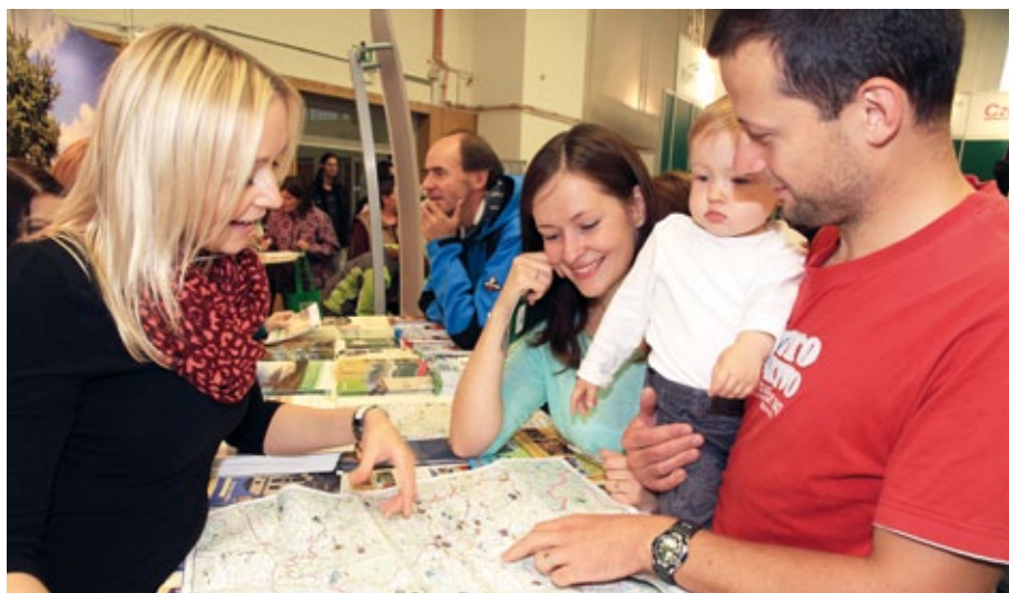
Zájem o turistické a propagační brožury měly celé rodiny.

Milovníci cestování a turistiky měli i letos z čeho vybírat. Veletrh ITEP nabídl téměř 120 vystavovatelů, z toho asi 20 zahraničních. Nepřeberné množství propagačních materiálů i konkrétních pobytových nabídek za zvýhodněnou cenu nejen z celé České republiky, ale i ze Slovenska, Itálie a především z Německa, čekalo na více než 11 tisíc návštěvníků ITEPu. Velkému zájmu široké veřejnosti se těšilo jak gastro oddělení