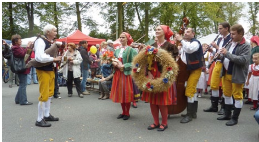
Členové folklorního souboru Úsměv s dožínkovým věncem.