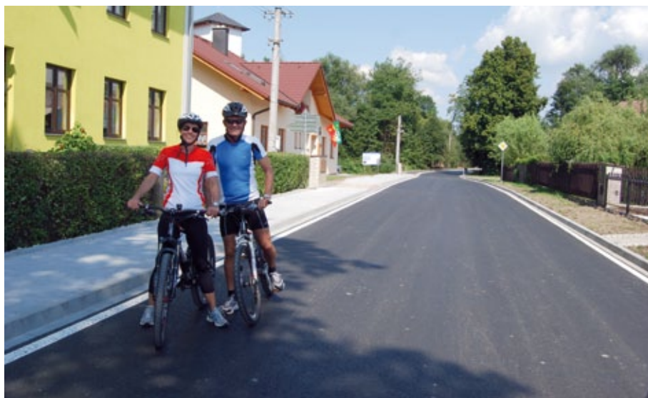
Průtah Chudenínem, rekonstruovaný s pomocí evropských fondů, už slouží nejen místním občanům, ale i turistům z obou stran česko-bavorské hranice.

„Peněz na obnovu silnic v kraji je zoufale málo, to souvisí s nelogickým rozdělováním prostředků ze strany státu,“ říká