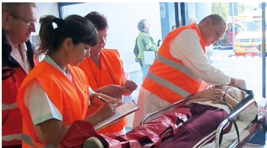
Lékaři Klatovské nemocnice si přebírají od záchranářů zraněné po nehodě autobusu. Hromadný příjem je přímo ve vestibulu nemocnice.

Kontaktní místo průběžně aktualizuje, kolik lidí a přibližně s jakým zraněním bude do nemocnice přivezeno a předává informace dál. Do vestibulu nemocnice, který se mění na hlavní příjem, je povolán zdravotnický personál, který zajišťuje