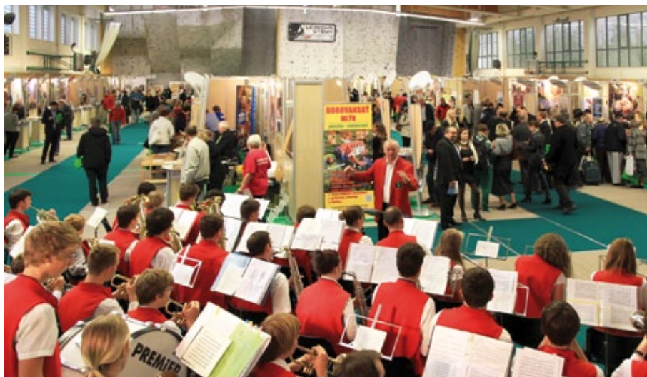
Veletrh ITEP 2013 zpestřilo vystoupení Velkého dechového orchestru ZUŠ Chválenická.