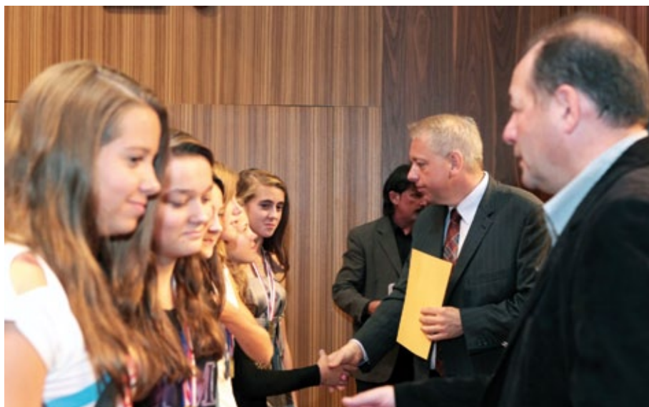
Úspěšným medailistům popřál hejtman Milan Chovanec (ČSSD) a náměstek Jiří Struček (ČSSD) – vpředu.

Gratulace putuje všem úspěšným olympionikům. Mnozí z nich budou reprezentovat Plzeňský kraj na Hrách VII. olympiády dětí a mládeže v roce 2015, která se uskuteční v Plzeňském kraji.