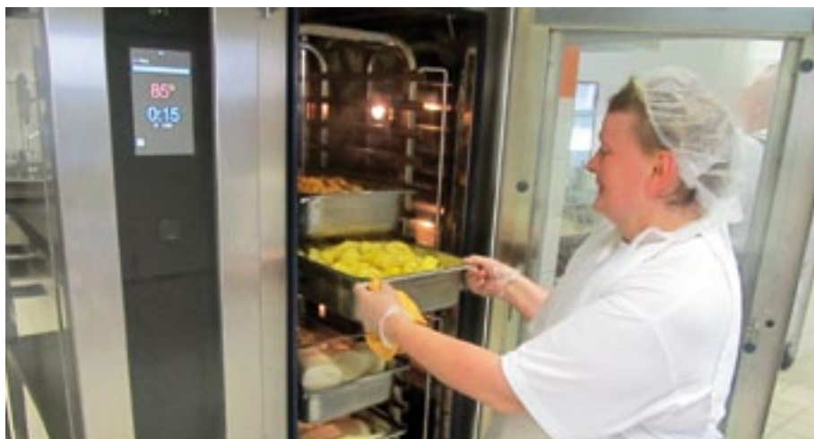
Pracovnice kuchyně klatovské nemocnice vyndává z konvektomatu přílohy k servírování.

Dále se vybavily přípravná masa, studené kuchyně a cukrářská příprava. Provoz už je vybaven pro takzvaný tabletový systém, kdy je pacientům jídlo dopravováno v tepelně chráněném boxu zvaném tablet až do jídelny na oddělení nebo přímo k lůžku.