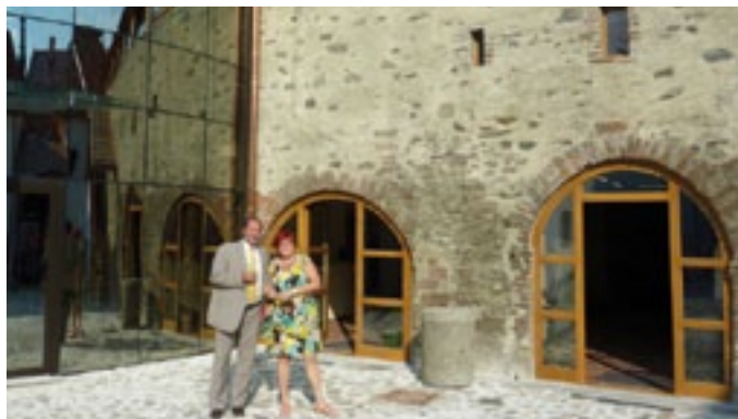
Současný vzhled Muzea Šumavy by měl přiblížit tehdejší podobu.

nově zastřešený, byly položeny nové podlahy v přízemí i v patře a obnoveny veškeré sítě. Všechny instalace i sítě včetně