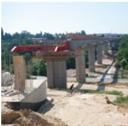
Dominantou západního obchvatu Plzně je most přes údolí Vejprnického potoka. Bude mít dva jízdní pruhy a povede po něm i stezka pro pěší a cyklisty.

„Dokončení této stavby je plzeňskou veřejností horečně očekáváno, protože tudy projíždí přes dvacet tisíc vozidel denně a současný stav je skutečně zoufalý,“ tvrdí