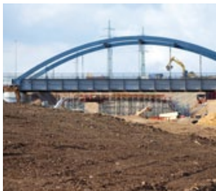
Západní obchvat Plzně bude mít Skvrňany v zářezu terénu, přes který se už klene nový železniční most.