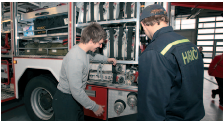
Na pořízení nového zásahového vozidla pro stanici Plzeň-střed se podílel i Plzeňský kraj.

V roce 2011 poskytl Plzeňský kraj na účelově určených dotacích na podporu činnosti sboru opět bezmála 14 milionů korun.