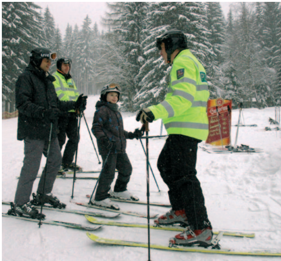
V zimě pak hlídky kontrolují na lyžích také lyžaře nejen na šumavském Špičáku.