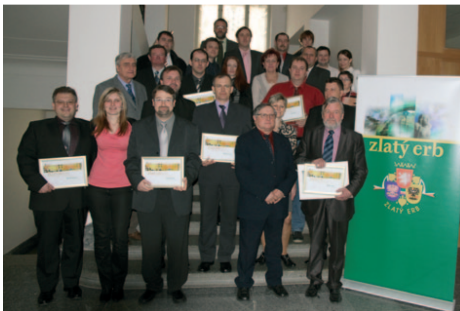
Vítězové letošního ročníku Zlatý erb.

„V každé kategorii soutěžilo zhruba 20 obcí, které hodnotila desetičlenná porota. Smysl soutěže Zlatý erb je nejenom ve vlastním srovnání webů měst a obcí, ale poskytuje také jejich webmasterům a pro-