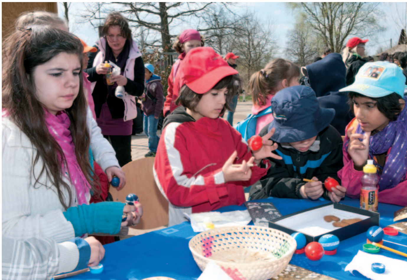
Děti z dětského domova zdobily velikonoční vajíčka.

s velikonočním workshopem, kde si barvily vajíčka, pletly pomlázky a měly možnost poznat další různorodé velikonoční zvyky. Na závěr je potěšilo vystoupení Světlany Nálepkové a připravený program v Domě pohádek, kam je odvezl „ZOO vláček“.