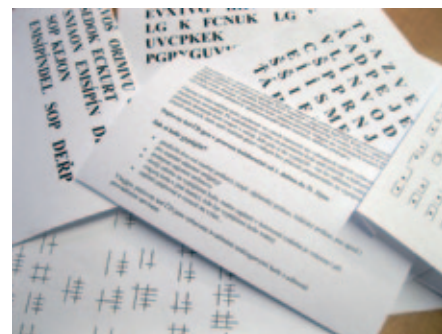
Ilustrační foto k soutěži Šifrovačka.

Abby malí cestovatelé získali zajímavé ceny, musí tak například ujet vlakem co nejvíce kilometrů a vše si pečlivě zaznamenat do knížky, kilometrické banky. Také mohou vyhledávat tabulky s údajem nadmořské výšky, které jsou umístěné na některých železničních stanicích. Žáci základních škol byli osloveni, aby napsali úvahu či vyprávění na zadané téma, předškoláci zase malují, tvoří koláže. Na adresu společnosti Poved s.r.o. (Plzeňský organizátor veřejné dopravy) došlo už přes desítku velmi zdařilých prací, zejména od těch nejmenších z mateřských škol, které budou po vyhodnocení výsledků vystaveny v prostorách Krajského úřadu Plzeňského kraje nebo v budově hlavního nádraží ČD v Plzni.