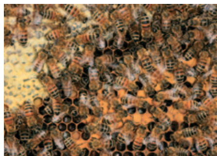
Díky podpoře Plzeňského kraje narostl počet včelstev v regionu.

„Zatímco v roce 2008 a 2009 byla Plzeňským krajem poskytnuta dotace v celkové výši půl milionu korun, v roce 2010 vzrostla na 1,5 milionu korun. V roce 2011 byly dotace navýšeny do-