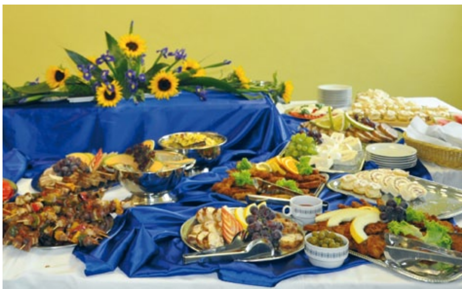
Ukázka práce žáků oboru Stravovací a ubytovací služby Odborného učiliště.

Nemohu říci, že jsem nebyla zaskočena novelou školského zákona, ze které vyplývá, že ředitel, který je ve funkci déle než 6 let a chce pokračovat ve své práci i nadále, musí projít konkurzním řízením. Pokud by se tak nestalo, mohly by po 1. 8. 2012 nastat komplikované situace, které mohou mít za následek závažné dopady. Já sama jsem se konkurzního řízení již zúčastnila. Konkurz mně posloužil nejen k rekapitulaci mé dosavadní profesní práce, ale i k nastartování nových nápadů a k motivaci do dalších let.