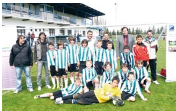
Kvalifikační turnaj mladých fotbalistů v Přešticích.

Účastníci turnajů obdrželi od Plzeňského kraje a společnosti NET4GAS kvalitní dresy v barvách kraje.