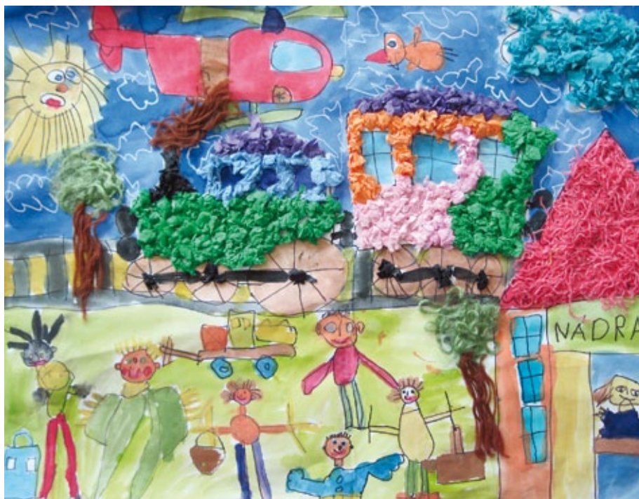
Jedna z vítězných prací.

Organizátoři projektu by však rádi poděkovali všem účastníkům, kteří svými nápady přispěli do této soutěže. Obdrží diplom a práce si mohou prohlédnout na www.poved.cz , kde jsou všechny zveřejněny.