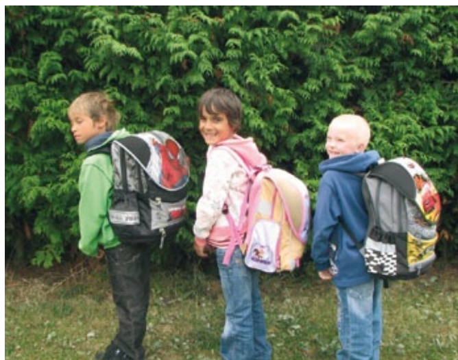
Děti z Domina rády chodí do přírody, letos se vypraví i k moři.