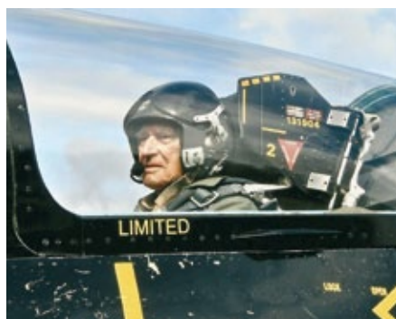
V roce 2008 v proudovém Albatrosu.

„Řekli mi tu, že jsem dostal vstupní vízum do Československa omylem. Tak jsem raději na nic nečekal a zase jsem rychle odjel,“ říká dnes už bez hořkosti v hlase tento válečný veterán a exulant z donucení.