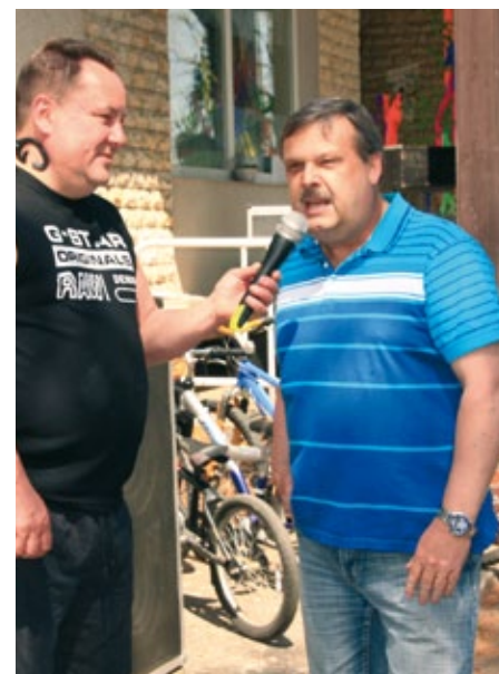
Poslanec Václav Votava (ČSSD) při rozhovoru pro média.