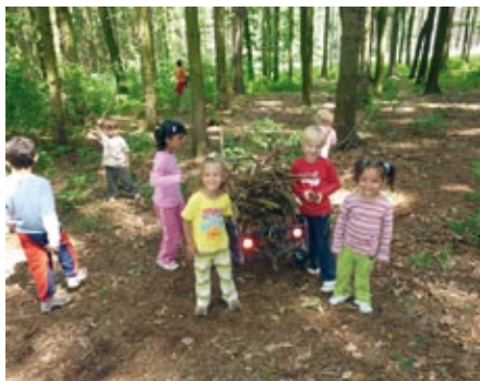
Prckové z Trnové si užívali jaro na Šumavě.

Dětské domovy v České republice jsou financovány z prostředků jednotlivých krajů podle přesně daných zásad. V Plzeňském kraji je to ale trochu jinak. Pro každý ze sedmi dětských domovů, které působí na území našeho kraje, se na Krajském úřadě v Plzni našly ještě další prostředky, jak dětem život zpříjemnit, a nejsou to prostředky malé. Na každé zařízení připadne přibližně 200 tisíc korun.