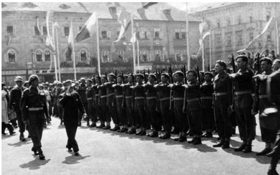
Přehlídka Čsl. obrněné brigády v Plzni 15. června 1945 za účasti prezidenta E. Beneše.

„Na evropskou pevninu se brigáda přemístila 30. srpna 1944. Čítala 4 300 mužů