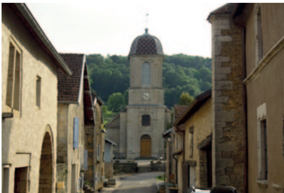
Rue de l'église s kostelem v Chariez. (Rue de l'église by se přeložilo jako ulice u kostela nebo kostelní ulice).

Musím uznat, že ve Francii mě spousta věcí hodně překvapila a zaskočila. Už jenom sami Francouzi uvažují a jednájí trochu jinak než já a než jsem očekával, což mi dělá občas problémy. Co se týče jejich stylu života, nikam nespíchají, nic neřeší, dokud to nehoří, zkrátka mají svůj klid na vše. Nemají moc zájmů, protože je nestíhají (škola zde končí v pět až šest hodin večer) a nejsou moc samostatní.