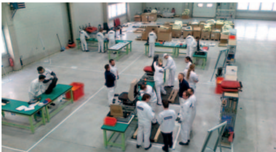
Nový závod v blízkosti obce Nýřany zaměstná více než 800 lidí.

Samotná výroba nabídne až 700 volných pozic operátorů, na které budou přijímáni hlavně lidé z Plzně a okolí. Výroba poskytne do konce roku 2013 přes 300 pracovních míst, dalších 400 volných pozic bude v následujících letech. Protože jsou výrobní procesy hodně specifické, všichni