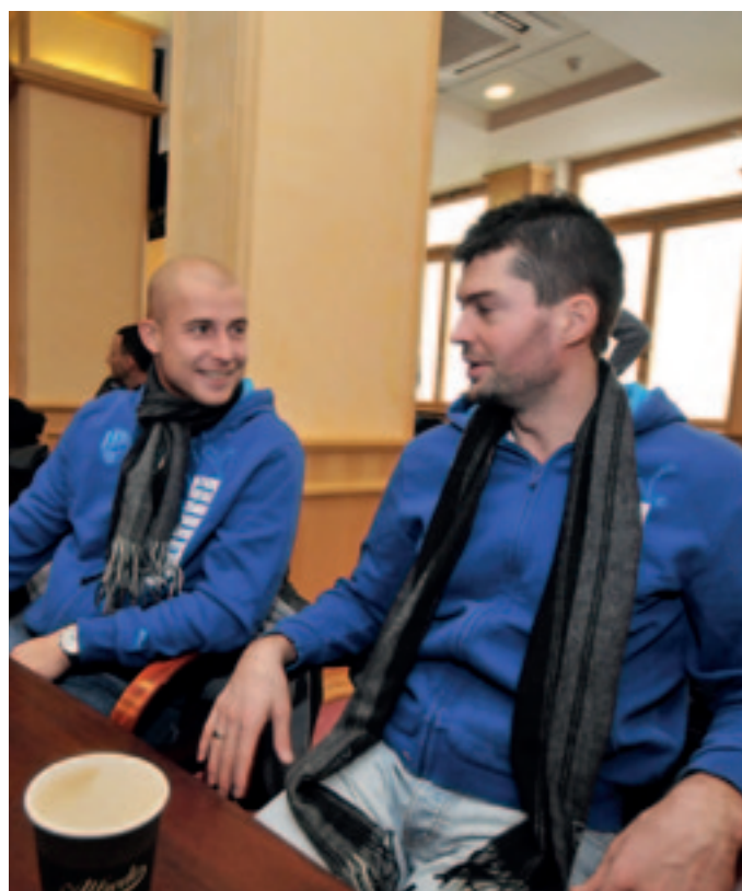
Hráči FC Viktoria Plzeň obdrželi jako dárek šálu s logem Plzeňského kraje.