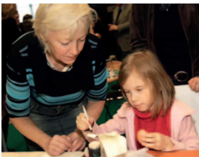
Program ve stánku Plzeňského kraje byl připraven i pro nejmenší návštěvníky veletrhu.