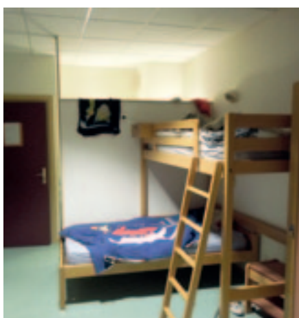
Pokoj na internátu. Tento je 3lůžkový, jsou zde ale spíše 4lůžkové. Co se týče vybavení, každý tu má pracovní stůl se šuplíky, poličku a skříň, dále je tu společné umyvadlo na pokoji a společné sprchy a záchody na patře.