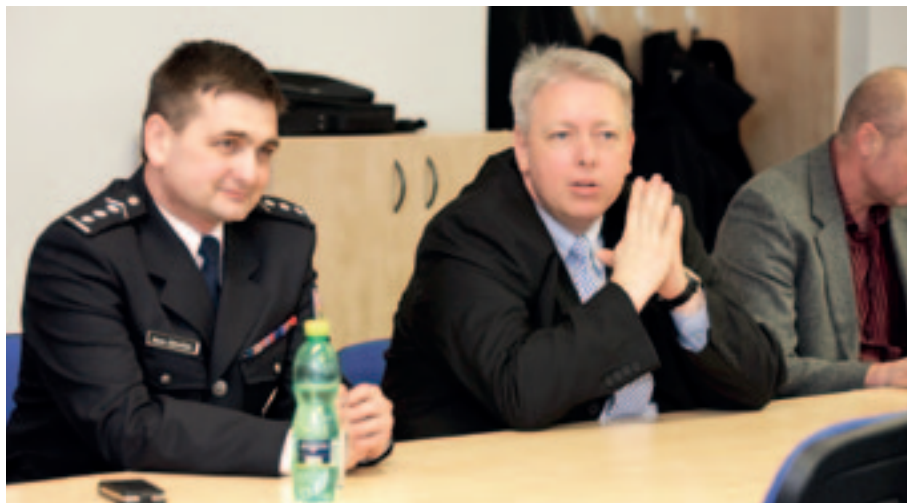
Policejní prezident Martin Červíček při setkání s hejtmánem Plzeňského kraje Milanem Chovancem.

Policejní prezident uvedl, že za rok 2012 došlo na území Plzeňského kraje k poklesu trestné činnosti o 7%. Přesto byla ze strany starostů nejčastěji zmiňovaným tématem právě kriminalita. Ze společné diskuse vyplynulo, že starosty tíží zejména drogová problematika, především v příhraničních oblastech, a tzv. výherní automaty a kriminalita spojená s návštěvou heren.