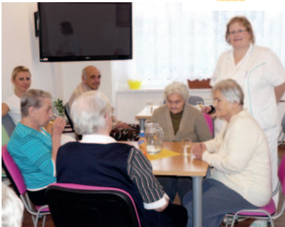
O uživatele Domova seniorů Panorama v Tachově se stará zkušený tým kvalifikovaných zaměstnanců.

O uživatele se stará zkušený tým kvalifikovaných zaměstnanců, kteří dle své odbornosti poskytují přímou obslužnou péči, ošetrovatelskou péči, fyzioterapii, canisterapii apod. Péče je poskytována podle