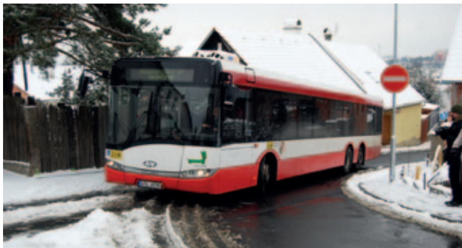
Dlouhý třínápravový autobus PMDP by se do Božkova opravdu nehodil a tahač s návěsem by devastoval okraje chodníků a ohrožoval chodce.