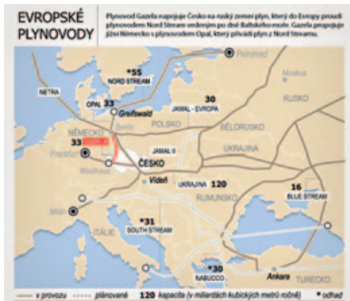
Grafický profil plynovodu Gazela.