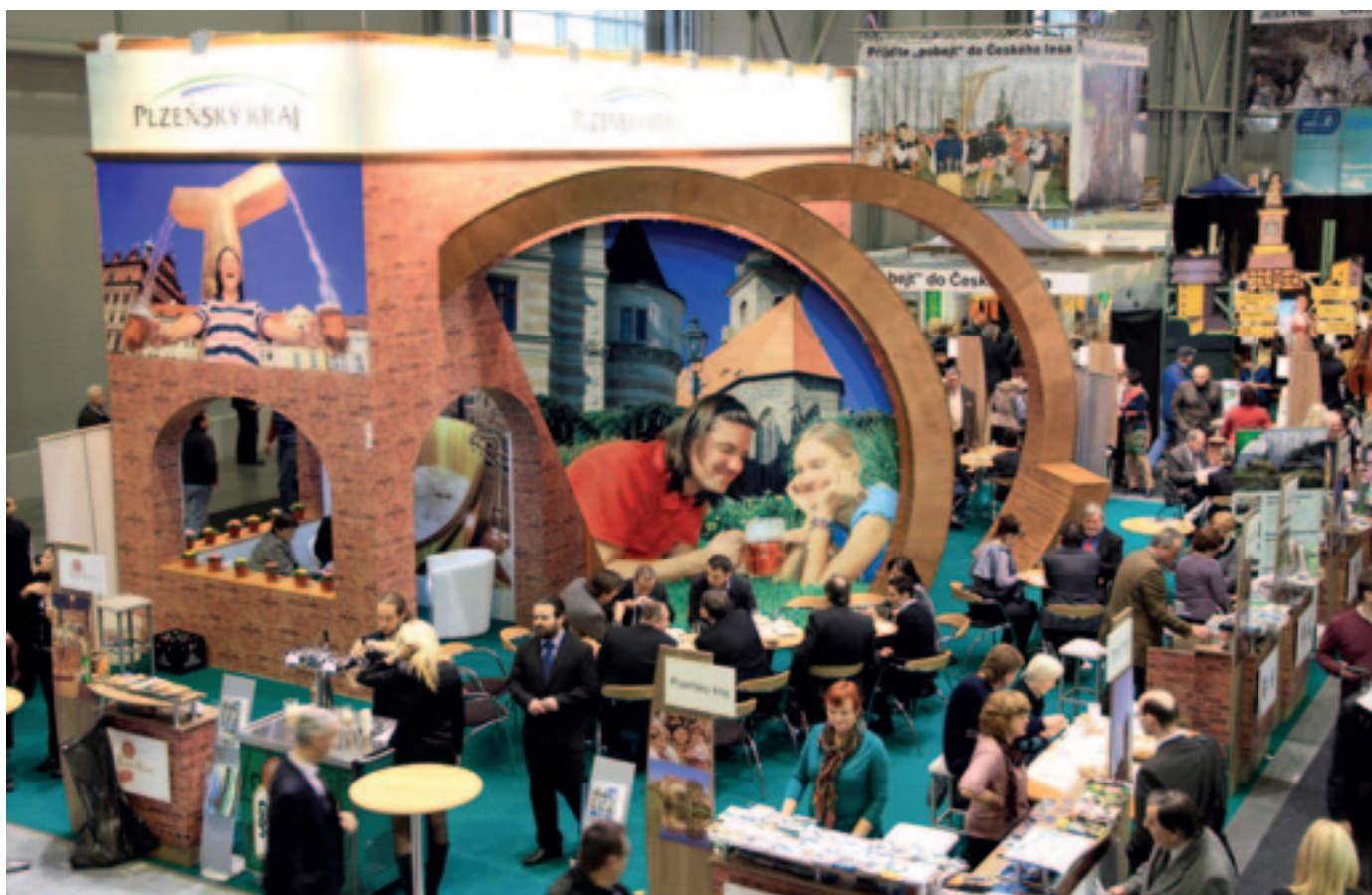
O nabídku propagačního stánku Plzeňského kraje byl mezi návštěvníky zájem.

mií“. Veletrh RegionTour, který proběhl ve dnech 17. až 20. ledna 2013 v prostorách BVV Brno opět přinesl detailní informace o aktuální turistické nabídce i novinkách pro letošní rok, spoustu inspirace k cestování a zajímavý doprovodný program.