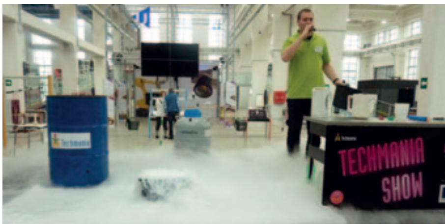
Při předávání ocenění školám byla na programu krátká moderovaná show atraktivně představující vlastnosti tekutého dusíku.

Desítky škol, které tyto možnosti neefektivněji využívají, byly uděleny certifikáty, opravňující jejich žáky k bezplatným a libovolně častým návštěvám Techmanie, a to až do konce