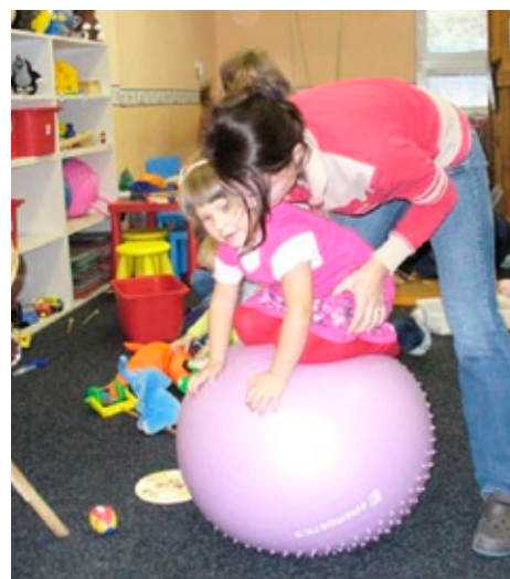
Cvičení s dětmi na tzv. overballu

Během června až září 2011 se podařilo zajistit vše potřebné k otevření prostorů Občanského sdružení veřejnosti, navázat spolupráci s několika dobrovolníky a institucemi a začít tak skutečně pomáhat těm, kteří to potřebují.