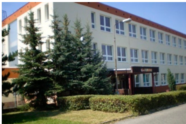
Hornobřízská střední škola

Byli bychom rádi, aby letošní maturanti navázali na vynikající výsledek v loňských maturitách, kdy naši žáci maturovali s úspěšností 91%. To je řadí na 1. a 2. místo v PK a mezi nejlepších 50 hodnocených tříd z 2800 v ČR