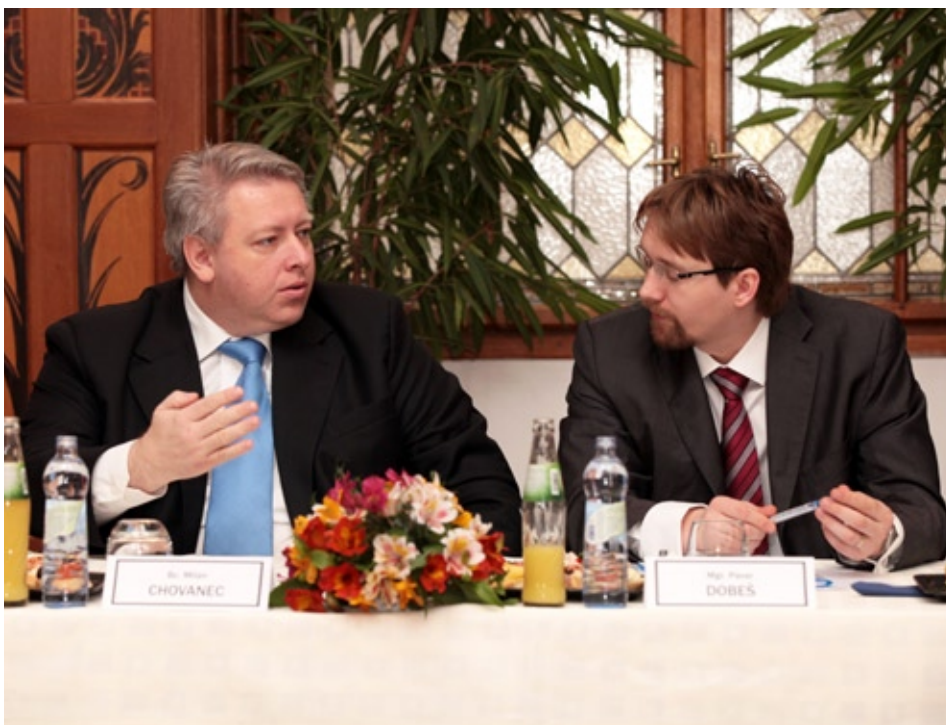
Hejtmán Milan Chovanec (ČSSD) a ministr dopravy Pavel Dobeš (VV) při ministrově návštěvě Plzeňského kraje

Vzhledem k důležitosti stavby celo krajského rozměru a významu v souvislosti s největší investicí Plzeňského kraje dojde na nejbližším setkání výboru Státního fondu dopravní infrastruktury (SFDI) k rozpočtovému opatření, které zajistí finanční prostředky ve výši 29 milionů korun ze strany ministerstva dopravy na výstavbu kruhového objezdu. O zbytek peněz se zasadí kraj. Křižovatka by měla být dokončena nejdéle do konce letošního roku.