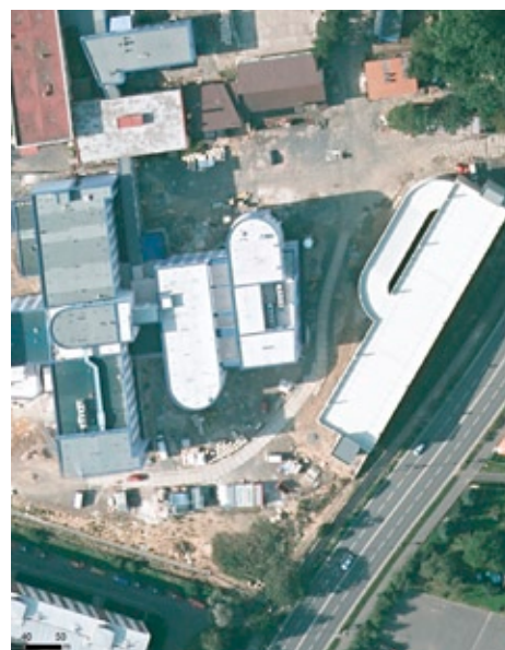
Letecký snímek nemocnice v Klatovech

Více informací o projektu Digitální mapa veřejné správy Plzeňského kraje najdete na adrese http://dmvs.plzensky-kraj.cz .