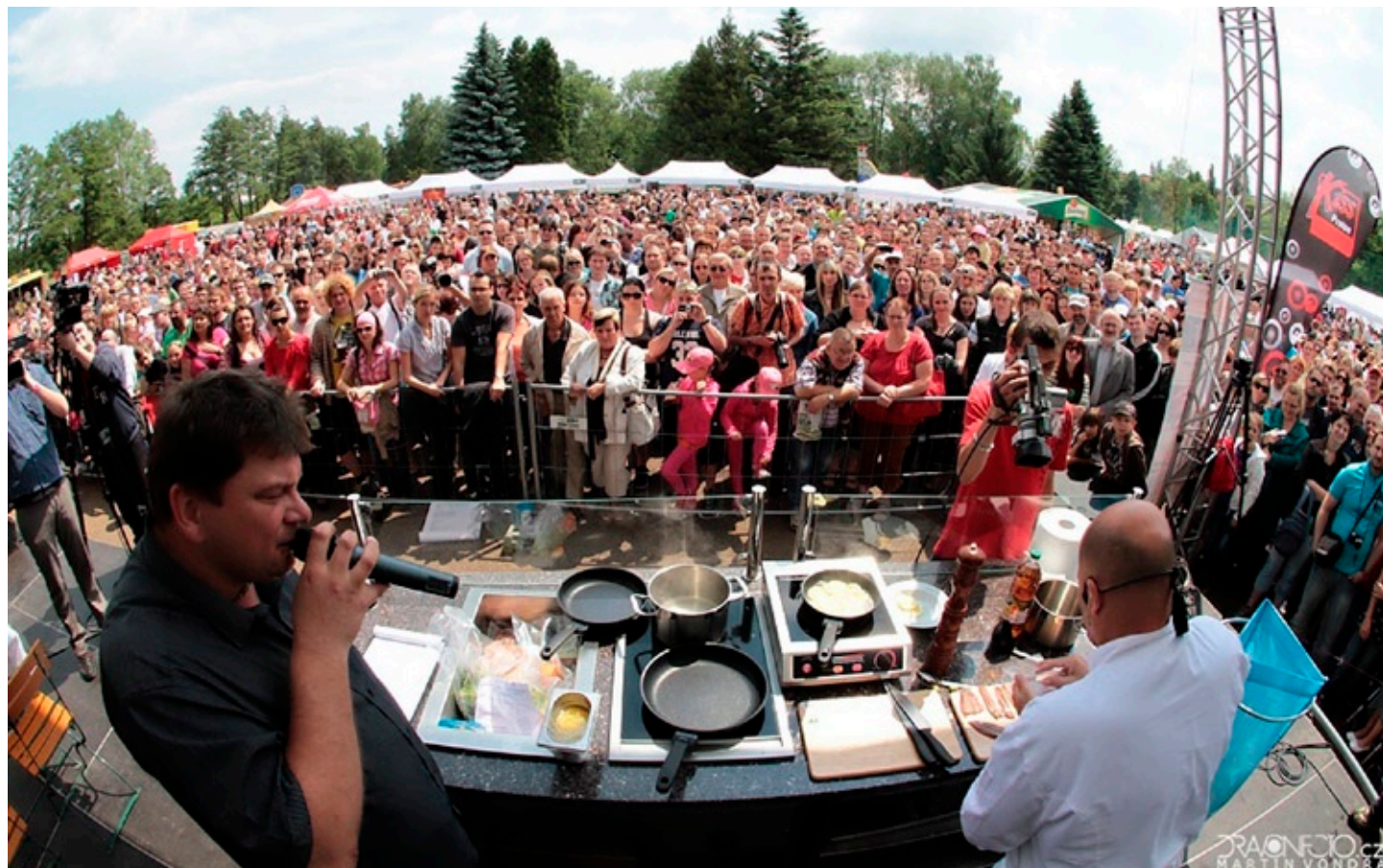
O APETITFESTIVAL byl v roce 2011 velký zájem

Podrobné informace najdete na www.apetitfestival.cz