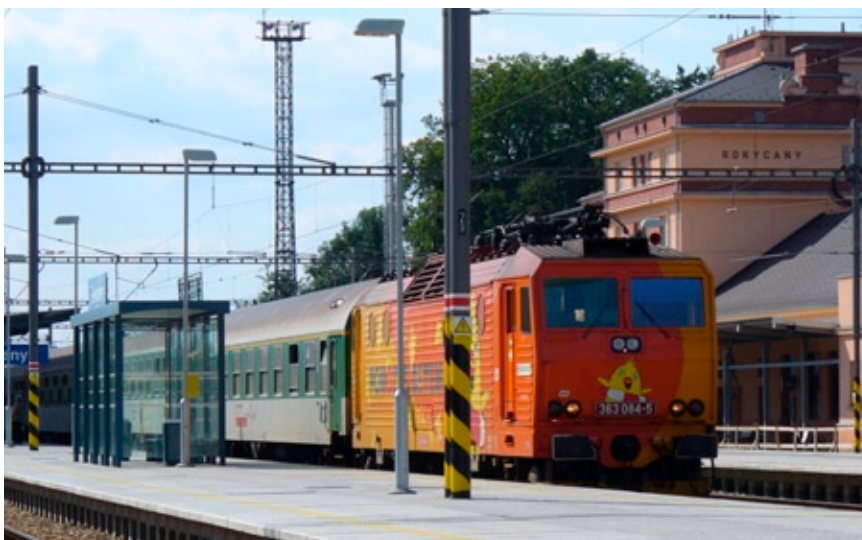
Cílem projektu Železnice dětem je přilákat děti do železniční dopravy

V lednu 2012 byla vyhlášena soutěž Nadmořské výšky. V železničních stanicích na úze-