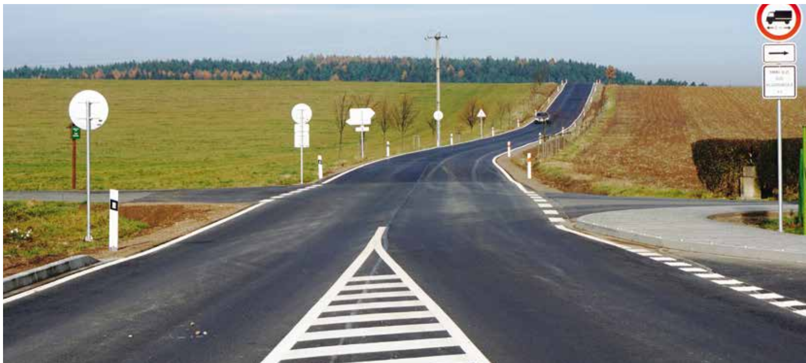
Část rekonstruované silnice Břasy-Liblín.