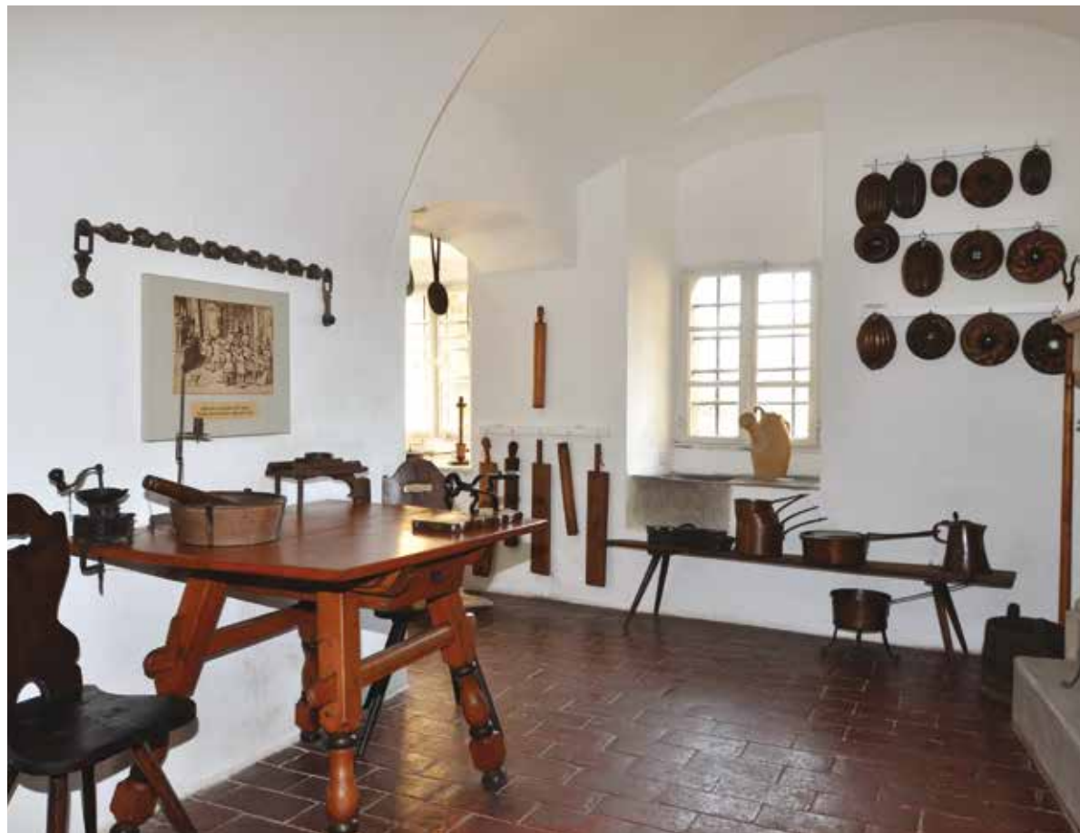
Současné expozice Národopisného muzea se brzy promění

Plzeňský kraj se znovu představil v Brně na veletrhu cestovního ruchu Go a Regiontour. V loňském roce se zapojil se svojí expozicí do celonárodní kampaně agentury Czech-Tourism na téma baroko, letos je aktuálním tématem 100 let republiky. Nadšení návštěvníci se tu mohli zapojit do vědomostní hry, kde odpovídali na otázky z historie od roku 1918 až do současnosti. Ve čtenářském koutku zase s chutí nahlédli do historických denních tisků.