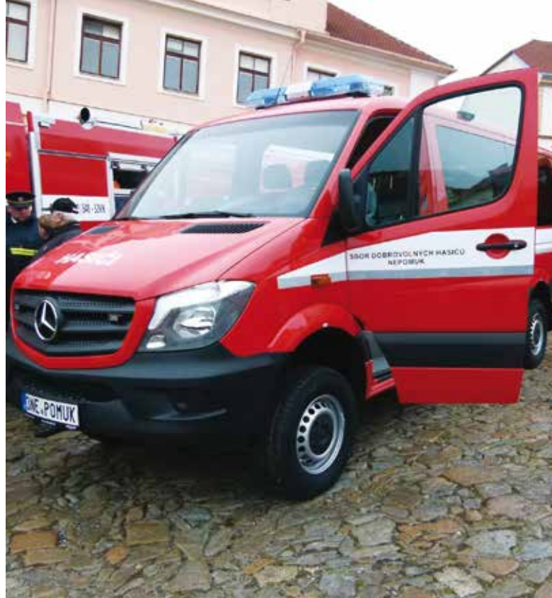
Nové vozidlo nepomuckých hasičů

V loňském roce měly jednotky sboru dobrovolných hasičů opět možnost čerpat z několika dotačních titulů. Dotace plynuly od ministerstva vnitra i z rozpočtu Plzeňského kraje z dotačního titulu „Podpora jednotek SDH obcí Plzeňského kraje“ a z evropských fondů z programu IROP. „Díky těmto dotacím byl umožněn nákup například mobilní požární techniky, zásahové obuvi a zásahových obleků,“ uvedl Petr Poncar, tiskový mluvčí HZS Plzeňského kraje. „Probíhala i rekonstrukce požárních zbrojnic a byla provedena rozsáhlá oprava čtyř automobilových stříkaček, nákup dvou nových cisternových stříkaček a nákup 24 dopravních automobilů.“ Menšími opravami prošly i dvě cisternové automobilové stříkačky. Na věcné vybavení byly rozděleny téměř čtyři miliony korun pro 108 jednotek SDH obcí, což dělá v průměru 36 639 korun na jednotku. Na stavbu či rekonstrukci požárních zbrojnic bylo rozděleno mimo dotační krajský program 9 379 000 korun. „Plzeňský kraj se stal nejúspěšnějším žadatelem o dotaci z programu IROP na nákup mobilní požární techniky. Počet úspěšných žádostí tvořil více než 22 % z celkového počtu úspěšných žádostí v rámci celé ČR,“ upřesnil Petr Poncar. Ve výsledku to znamená, že byla schválena dotace na 13 cisternových automobilových stříkaček a 28 dopravních automobilů.