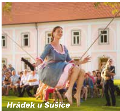
Hrádek u Sušice