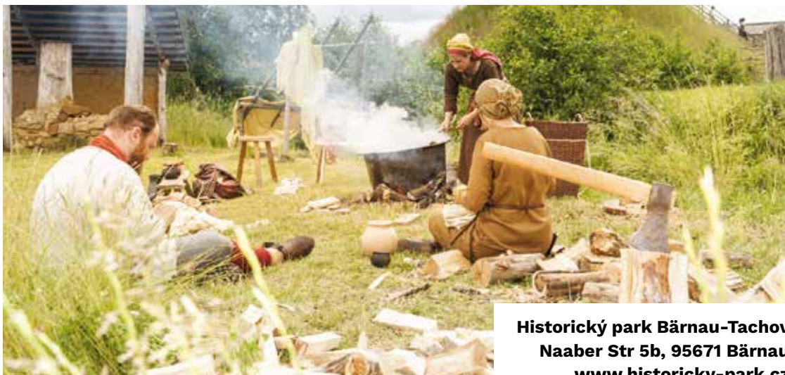
Historický park Bärnau-Tachov Naaber Str 5b, 95671 Bärnau www.historicky-park.cz