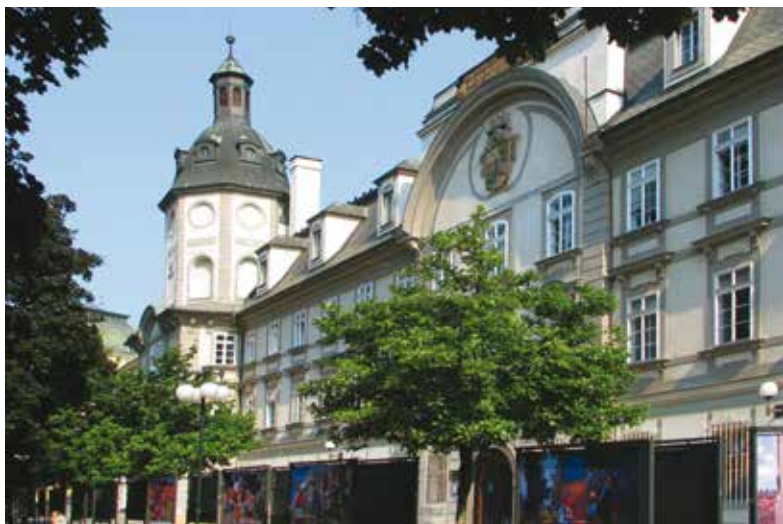
Budova Studijní a vědecké knihovny Plzeňského kraje

Nová situace přinese školám i knihovně především pocit jistoty. A pak také konečně šanci žádat o peníze z rozvojových programů. Pokud by kraj v budoucnu přestal budovy využívat pro školské a vzdělávací účely, za stejných podmínek je vrátí městu zpátky. Případné provedené investice by byly zohledněny podle stanoveného vzorce.