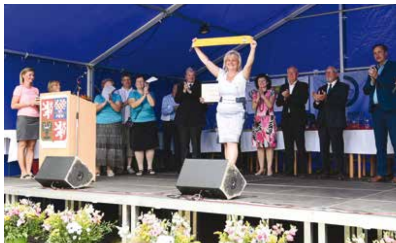
Vyhlášení Vesnice roku 2018 v Kamenném Újezdě.

„Kraj samotný a ani jednotlivá větší města to nezvládnou. Nezbytná je pomoc z centra,“ říká a vysvětluje, že je nutné na venkově udělat atraktivní podmínky pro život, aby mladé lidi nezlákaly příměstské aglomerace. „Za posledních deset let vidím, jak se sem stěhují. A až přijde hospodářský pokles, bude se situace zhoršovat,“ dodává. Po současných ekonomicky silných letech totiž propad určitě přijde. Tím se lidé z okolí, kteří splácí nemalé hypotéky, ocitnou v problémech a budou si hledat práci jinde – ve městě. A tomu chce Plzeňský kraj zabránit. „Musíme proto investovat do kvalitních silnic i dopravního spojení, do sítě praktických a dětských lékařů, do škol, občanské vybavenosti a obchodů, ale i do možností atraktivního trávení volného času. Protože dnes už mladé lidi nezajímá jen bydlení a práce, ale o tom, kde budou žít, rozhoduje i to, jak se tu budou moci bavit po práci a zda tu najdou zábavu i jejich