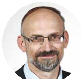
Pavel ČÍŽEK (STAROSTOVÉ A PATRIOTI) náměstek hejtmana Plzeňského kraje pro oblast dopravy