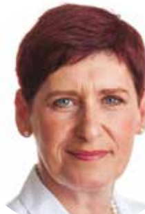
Marcela KREJSOVÁ (ODS) náměstkyně hejtmána pro oblast ekonomiky, investic a majetku