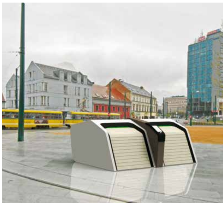
Vítězný návrh cykloboxu od Zuzany Bergmannové

Správa a údržba silnic Plzeňského kraje byla garantem projektu, jehož hlavním cílem je zajištění podmínek pro ukládání jízdních kol na zastávkách veřejné dopravy tak, aby se zvýšil počet cestujících, kteří díky možnosti bezpečného uložení kola využijí veřejnou dopravu. Součástí projektu je uzamykatelný cyklobox a stojan na kola. Předpokládá se, že cykloboxy najdou využití i na jiných místech – například u turistických atrakcí, škol, stravovacích či nákupních zařízení apod. Řešení designu mobiliáře proběhlo ve spolupráci s Fakultou designu a umění Ladislava Sutnara Západočeské univerzity v Plzni. Byla vyhlášena dvoukolová studentská soutěž, které se zúčastnili studenti 4. ročníku. Podáno bylo celkem osm