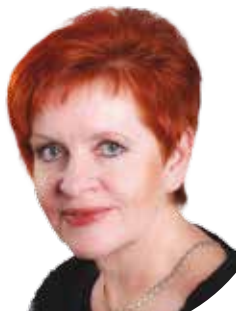
Ivana BARTOŠOVÁ (KPPK) náměstkyně hejtmána pro oblast školství a cestovního ruchu