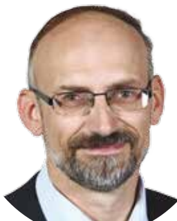
Pavel ČÍŽEK (STAROSTOVÉ A PATRIOTI) náměstek hejtmána pro oblast dopravy Plzeňského kraje