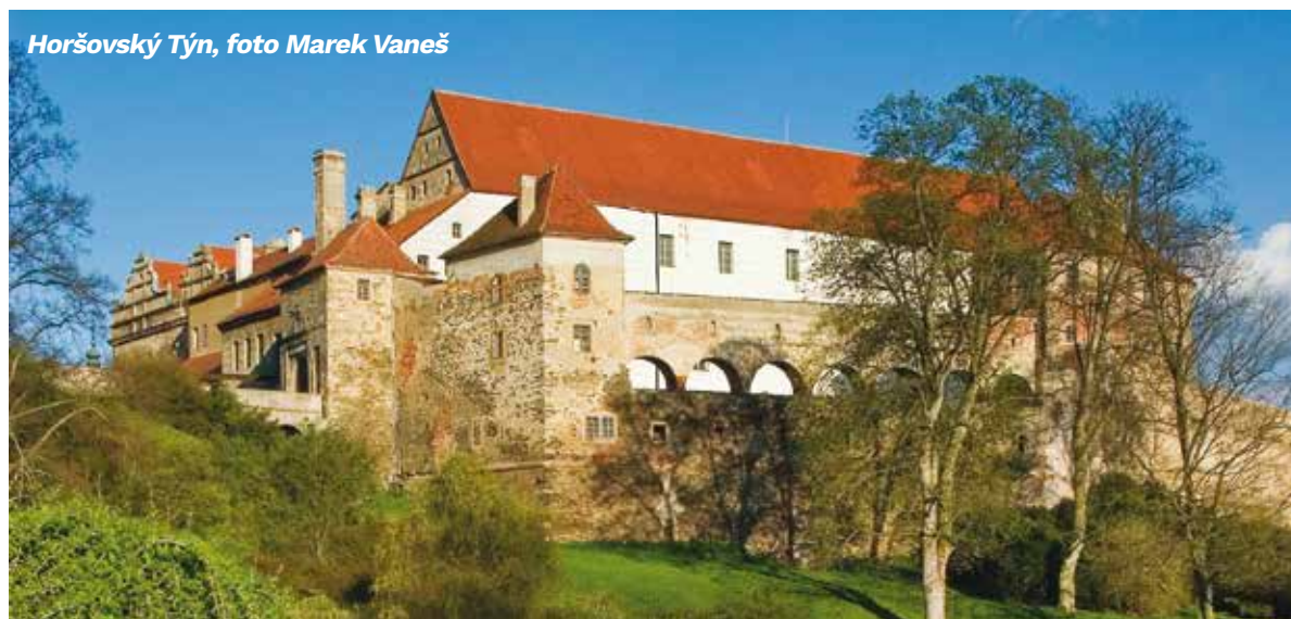
Horšovský Týn

Letošní ročník je opět v elektronické podobě, podstatně se ale zjednodušila pravidla. Stačí se zaregistrovat a můžete začít hrát. Soutěž nabízí padesát turistických cílů, mezi nimiž jsou známé hrady a zámky, ale také nové naučné stezky, rozhledny či zajímavé přírodní útvary. Významnou novinkou je také nižší počet cílů, které je třeba navštívit, aby se soutěžící dostal do závěrečného losování. Stačit jich bude patnáct. A na speciální cenu se může těšit soutěžící, který navštíví cílů nejvíc. Jak se do soutěže zapojit? Přihlásit se každý může kdykoliv až do konce prázdnin na webových stránkách Prázdninové štafety. Vše potřebné najdete na adrese: http://stafeta.plzensky-kraj.cz . Při návštěvě každého cíle se soutěžící vyfotí na nádvoří či uvnitř navštívené-