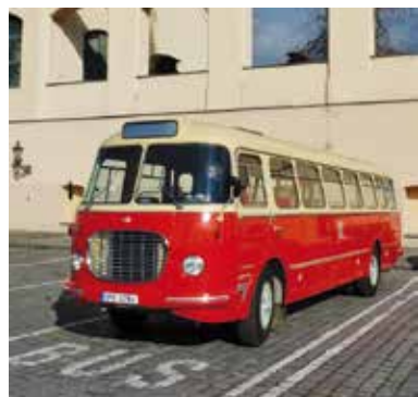
Historický autobus bude vyjždět během ITEPu na komentované trasy severním Plzeňskem

Až se letošní dovolenková sezona sklóní ke svému závěru, nastane opět čas na plánování dovolené příští. Za inspirací je dobře vyrazit na veletrh cestovního ruchu ITEP do Plzně. Ten letos přichystal několik novi-