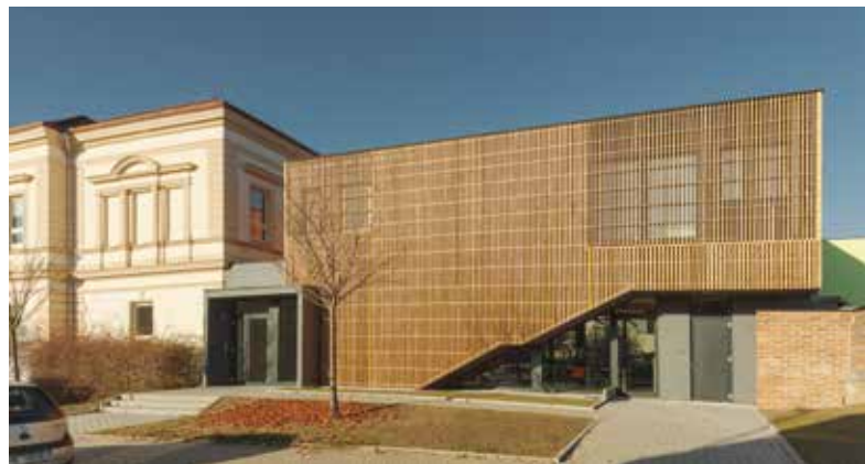
Přístavba družiny, Plzeň-Újezd

Soutěž stavba roku Plzeňského kraje má v letošním ročníku tři vítěze hlavní ceny, a to v kategoriích Novostavby budov, Dopravní a inženýrské stavby a Veřejná prostranství. Titul si odnesla přístavba školní družiny Plzeň – Újezd, modernizace trati Rokycany – Plzeň a obnova Lobežského parku. Další ocenění získala například rekonstrukce náměstí v Plané, sportovní areál v Dobřanech nebo obnova Vrchlického sadů v Klatovech.