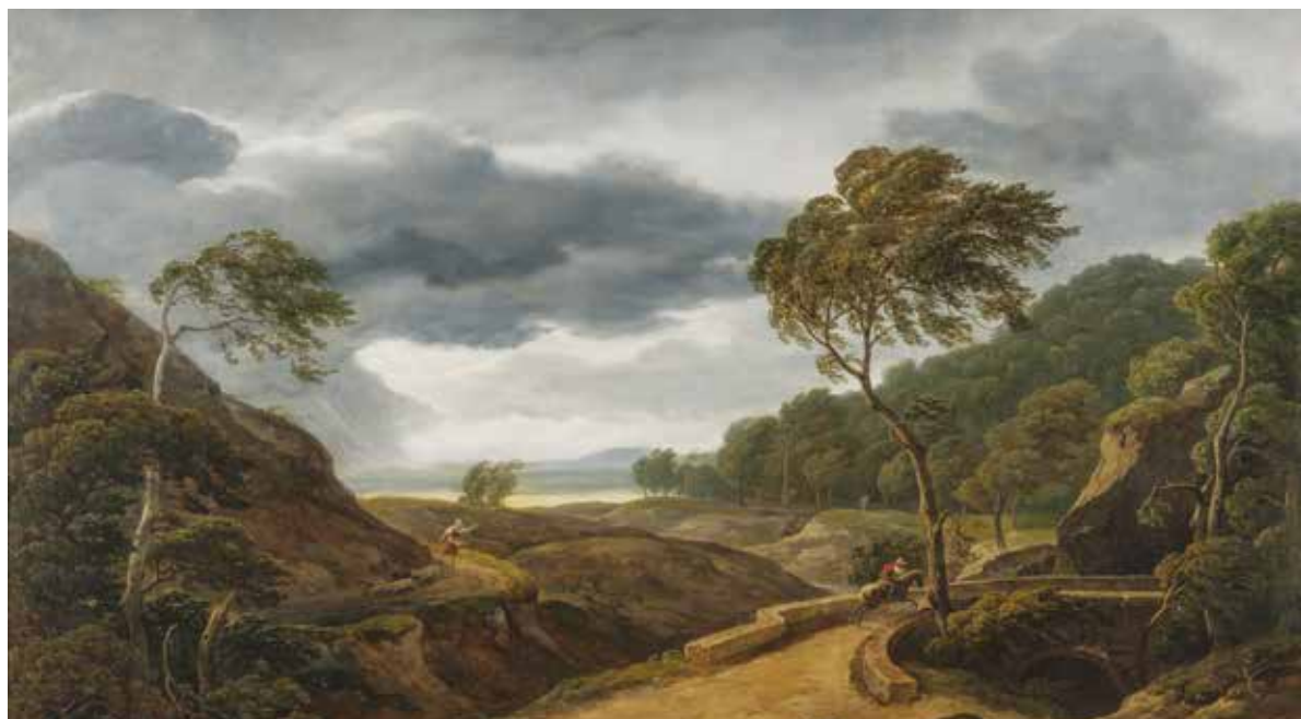
Antonín Mánes, Krajina (Bouře u Cibulky) , 1840, Moravská galerie v Brně

Na stejnojmenné výstavě představuje Západočeská galerie v Masných krámech sbírky a sběratele mezi lety 1600 až 1960. Připomíná jména barokních šlechtických sběratelů, často vázaných k západním Čechám, jako byli Černínové, Lažanští, Šternberkové či Lob-