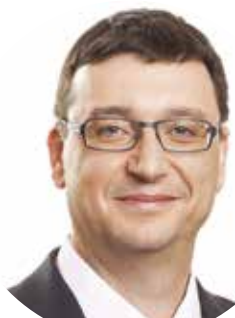
Richard PIKNER (TOP 09) zastupitel Plzeňského kraje