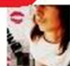
SárinQa SluNiško Crhová