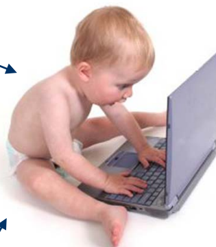
děti a mládež