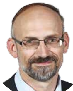
Pavel ČÍŽEK (STAROSTOVÉ A PATRIOTI) náměstek hejtmána Plzeňského kraje pro oblast dopravy