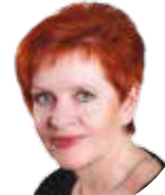
Ivana BARTOŠOVÁ (KPPK) náměstkyně hejtmana pro oblast školství a cestovního ruchu