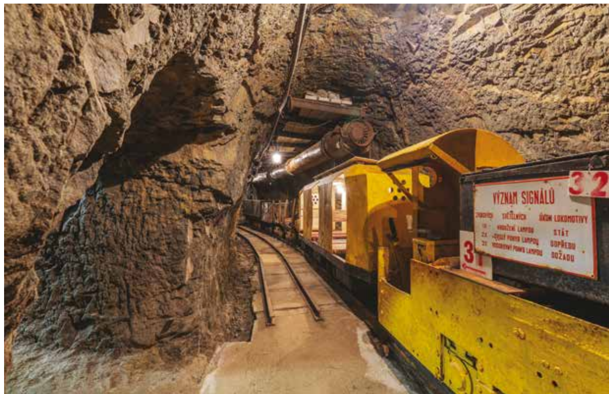
Hornické muzeum Planá

pozice Šumavská energie, kde můžete vidět například model území od Modravy po soutok Vydry a Křemelné.