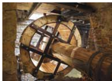
Vodní hamr Dobřív