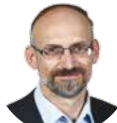
Pavel ČÍŽEK (STAROSTOVÉ A PATRIOTI) náměstek hejtmana pro oblast dopravy