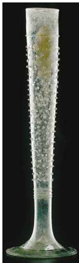
Vysoká číše tzv. českého typu zdobená po celém povrchu drobnými natavovanými skleněnými perličkami. Číše českého typu byly typickým výrobkem středověkých sklářských hutí a projevem gotického slohu na českém území. Ve středověké Plzni byly oblíbeným tvarem v měšťanském prostředí na sklonku 14. a v průběhu 15. století. Nález pochází ze zasypané středověké studny v Perlové ulici.

císařem Ferdinandem I. povýšen na erbovního měšťana. Jedná se o významný doklad renesanční keramické plastiky, který je ojedinělý v českém prostředí 2. poloviny 16. století. Plastika vykazuje znaky italské štukatérské práce, a to jak v použitém materiálu, tak v pojetí lva i erbovního štítu. Svým provedením vychází z italské terakotové plastiky, jak dokládají i zbytky dochovaného zlacení. Plastika byla zhotovena v letech 1565–1567, kdy Kašpar Kropáč z Kozince dům nechal renesančně přestavět.