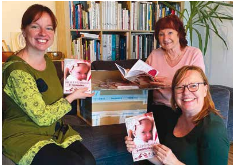
Autorky Nejlepší knihy o miminku... s její redaktorkou.

Přesně tak. Proto mě vždycky zajímá, jakou má maminka pro-