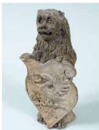
Keramická plastika (kamnový nástavec). Plastika vztyčeného lva držícího erbovní štít se znakem Kašpara Kropáče z Kozince. Nalezeno v zasypané studni v Plzni, Dominikánské ul. 2. Kašpar Kropáč z Kozince byl přední plzeňský humanistický básník působící ve Vídni a Plzni. Narodil se pravděpodobně roku 1539 a studoval v Sasku a Vídni. Do Plzně se navrátil roku 1563 a zemřel zde v roce 1580. Roku 1560 byl

císařem Ferdinandem I. povýšen na erbovního měšťana. Jedná se o významný doklad renesanční keramické plastiky, který je ojedinělý v českém prostředí 2. poloviny 16. století. Plastika vykazuje znaky italské štukatérské práce, a to jak v použitém materiálu, tak v pojetí lva i erbovního štítu. Svým provedením vychází z italské terakotové plastiky, jak dokládají i zbytky dochovaného zlacení. Plastika byla zhotovena v letech 1565–1567, kdy Kašpar Kropáč z Kozince dům nechal renesančně přestavět.