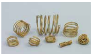
Svitky ze zlatého drátu z mohyl v Dýšině. Svitky sloužily jako ozdoba. Střední doba bronzová, česko-falcká mohylová kultura 1800–1300 př. n. l.

Západočeské muzeum v Plzni vzniklo v roce 1948 sloučením tří původně samostatných muzeí - Městského historického muzea, Západočeského uměleckoprůmyslového muzea v Plzni a Národopisného muzea Plzně a Plzeňska. Historické muzeum jako nejstarší z nich bylo založeno roku 1878. V roce 1946 se z jeho sbírek oddělil Archiv města Plzně. Roku 1950 byla z knihovny Historického muzea zřízena Studijní a vědecká knihovna v Plzni a v roce 1956 z uměleckých sbírek Západočeská galerie v Plzni. I přes tyto ztráty sbírkových fondů dnes Západočeské muzeum v Plzni patří mezi největší a nejvýznamnější muzea České republiky. Je muzeem vlastivědného typu nadregionálního významu a systematicky shromažďuje hmotné doklady minulosti přírody a společnosti nejen z území regionu. Mimořádně významné jsou sbírky archeologie, paleontologie, antické archeologie a sbírky orientu. Za svoji prezentační činnost bylo muzeum mnohokrát oceněno v národní soutěži Gloria musealis. Součástí muzea je Muzeum loutek v Plzni, Muzeum církevního umění Plzeňské diecéze, Muzeum Dr. Bohuslava Horáka v Rokycanech a národní kulturní památka Vodní hamr v Dobřívě. Muzeum je výzkumnou organizací, která řeší řadu výzkumných projektů základního i aplikovaného výzkumu.