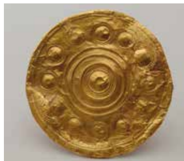
Terč ze zlatého plechu s tepanou výzdobou mykénského typu. Mohyla 3 Dýšina. Střední doba bronzová. Česko-falcká mohylová kultura. 1800–1300 př. n. l.