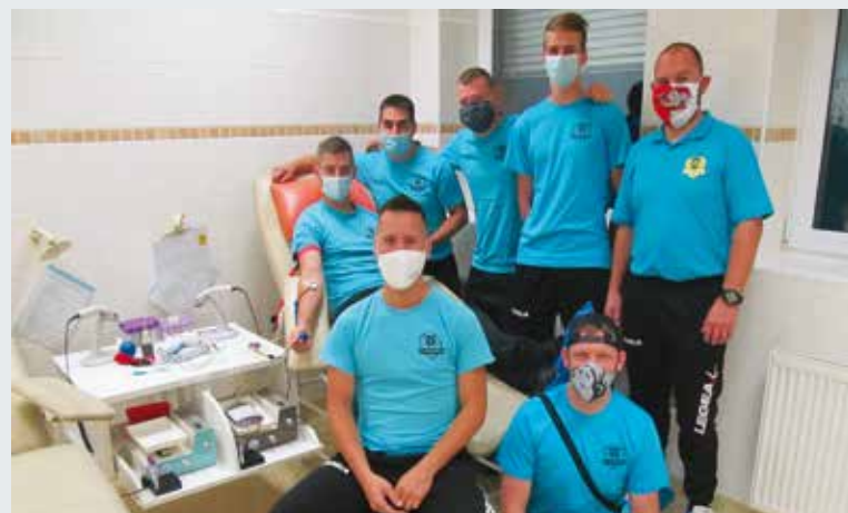
Do registru dárců krve v Rokycanské nemocnici se přihlásili společně i fotbalisté TJ Hrádek.