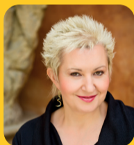
EVA URBANOVÁ/ OPERNÍ PĚVKYŇE

Je to jako s jinými vysoce nakažlivými nemocemi. Většina z nás bere jako samozřejmost být proti nim naočkováni. Nevidím žádný důvod, proč tuto situaci nevidět stejně. Chci chránit sebe i své nejbližší, na kterých mi záleží. Vždyť všichni se chceme opět setkávat a užívat si života.