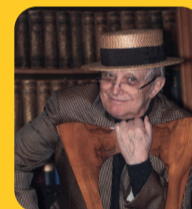
JÍŘÍ SUCHÝ/ ZPĚVÁK

Jediné východisko, abychom se mohli vrátit do normálu, je se naočkovat. Věřím odborníkům a lékařům. Proto se určitě naočkuji, až na mě přijde řada. Chci žít normálně a ne neustále řešit covid.