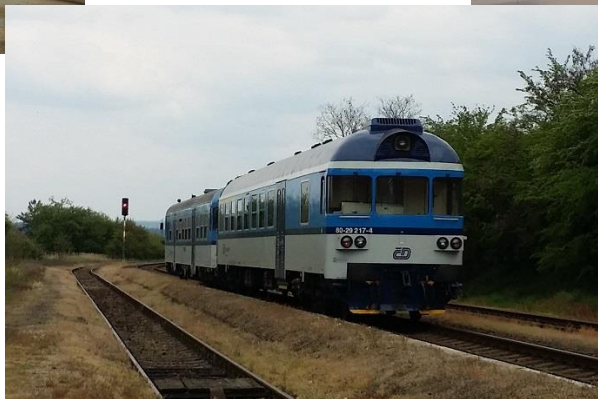
Řídící vůz (Trať 160)