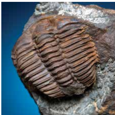
Conocoryphe sulzeri

Do plzeňské části Národního geoparku Barrandien spadá značná část Křivoklátska, ale najdeme tu i další přírodovědně