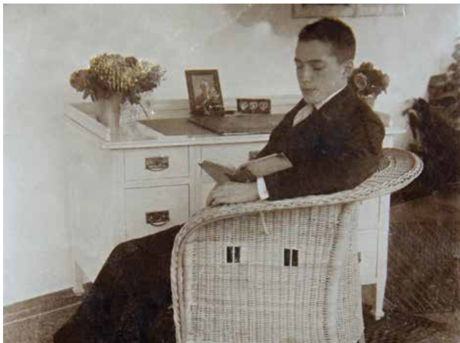
Richard Coudenhove-Kalergi jako student filosofie na zámku v Poběžovicích