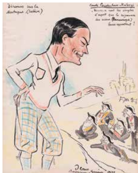
Karikatura z roku 1929 s názvem Kázání na Hoře - Richard Coudenhove-Kalergi káže v Ženevě udiveným evropským diplomatům o sjednocené Evropě.

Richard Coudenhove-Kalergi se narodil roku 1894 v Tokiu jako druhorozený syn majitele poběžovického zámku, rakousko-uherského