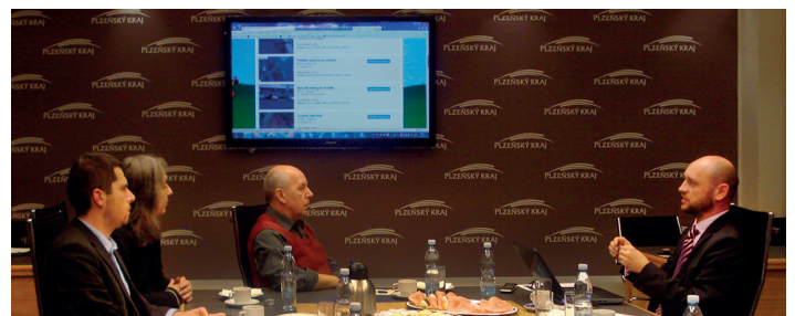
Konzultace Strategie transparentního Plzeňského kraje.