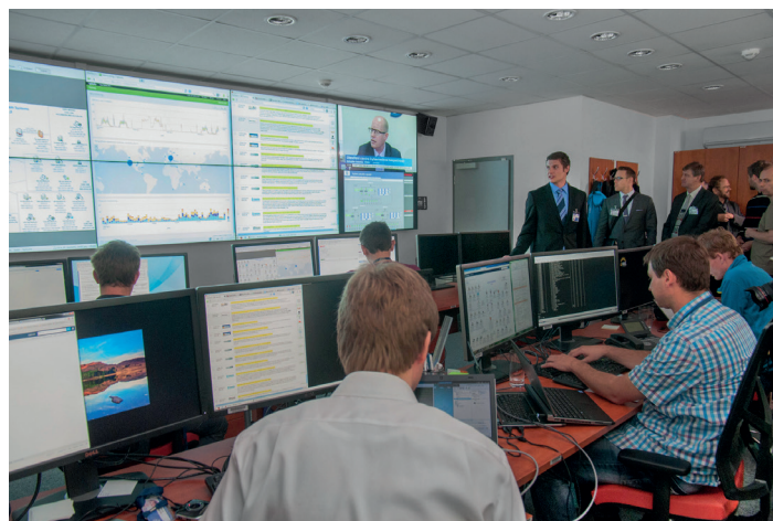
NBÚ buduje technologické centrum.

Vybrat špičkovou a zároveň z mnoha úhlů pohledu vyzkoušenou a ověřenou techniku nebylo jednoduché. Vůbec jednoduché pak nebylo tuto někdy rozměrnou a zároveň citlivou techniku instalovat v sice modernizované, ale přeci jen budově z 30. let minulého století. Nemalou roli samozřejmě hrála možnost nastavení bezpečnostních parametrů jednotlivých komponentů. Tady je namísto poděkovat také pracovníkům Odboru strukturálních fondů Ministerstva vnitra za věcný přístup při zpracovávání projektu i při jeho realizaci. Tím se řada potenciálních problémů vyřešila.