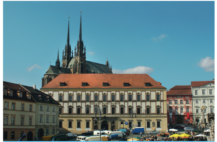
Budova Moravského zemského muzea v Brně.