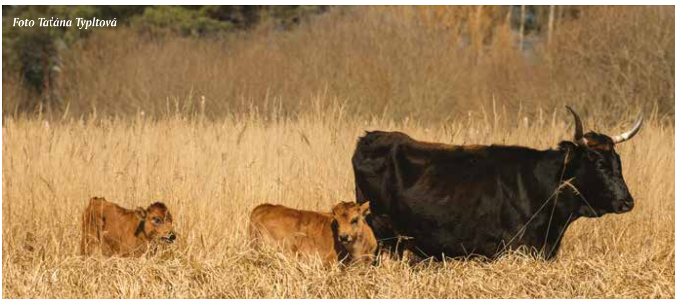
Do přírodní rezervace Janovský mokřad u Nýřan přišlo jaro. Zdejších praturům se narodila dvě telátka.