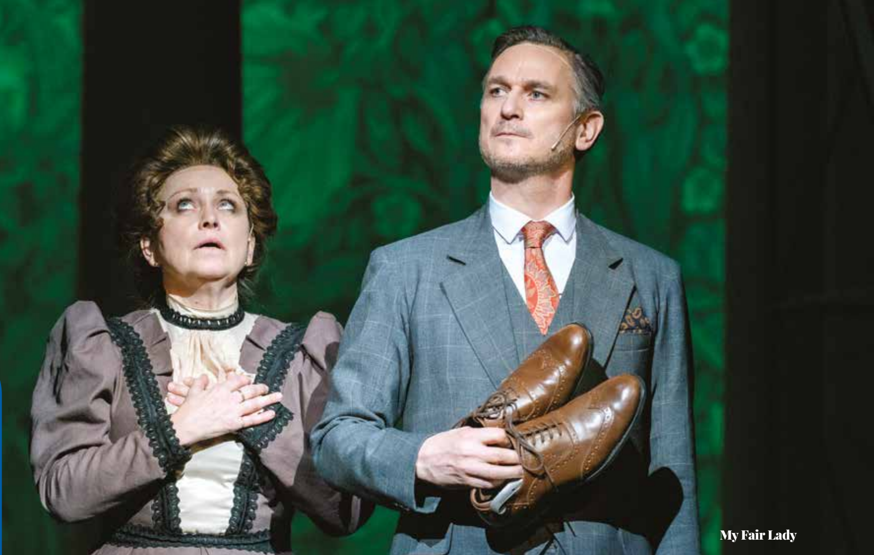
My Fair Lady