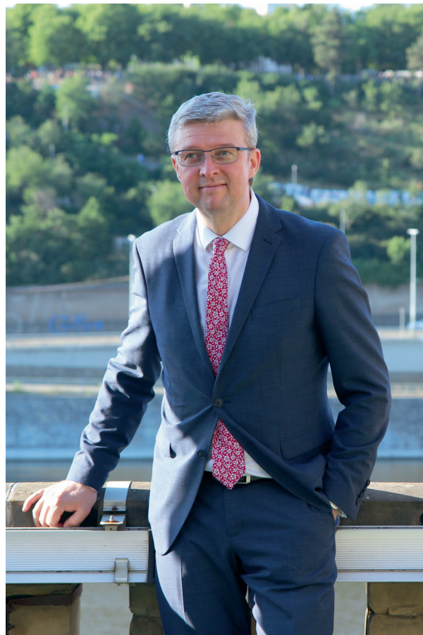
Doc. Ing. Karel Havlíček, Ph.D., MBA vicepremiér a ministr průmyslu a obchodu a ministr dopravy

Děkuji všem, kdo se na zpracování této příručky podíleli a věřím, že se stane praktickým pomocníkem a průvodcem pro ty, kteří jsou postaveni před úkol zorientovat se v tíživé životní situaci.