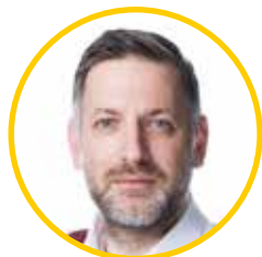
Rudolf ŠPOTÁK (PIRÁTI) hejtman Plzeňského kraje

Plzeňský kraj má zpracovanou koncepci rozvoje regionální silniční a železniční sítě, která byla schválena v orgánech kraje v roce 2021. Jedná se tedy o poměrně nový dokument, který reaguje na aktuální potřeby kraje v této oblasti. Řeší nejen rozvoj silniční sítě kraje, ale rovněž zkvalitnění stavebního stavu stávajících pozemních komunikací ve vlastnictví kraje, kterých je více než 4 600 km.