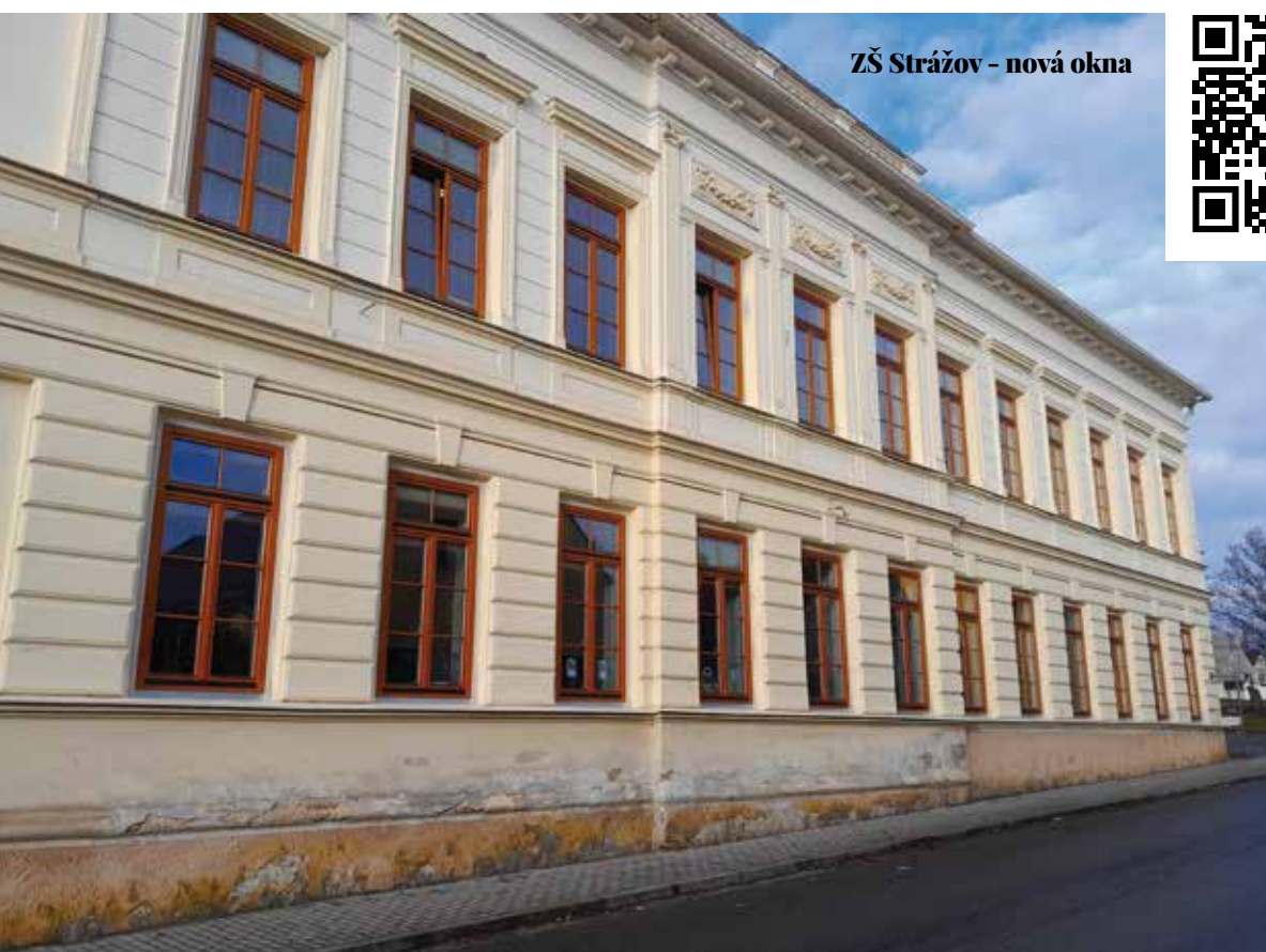
ZŠ Strážov - nová okna