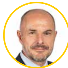
Josef BERNARD (STAN) náměstek hejtmána pro oblast životního prostředí a zemědělství

Běžné výdaje, navýšené oproti roku 2023 jen o 2,42 %, pokrývají veškeré běžné výdaje kraje a jeho příspěvkových organizací. Výdaje na investice a příspěvky obcím tvoří 43 % celkových výdajů. Kapitálové výdaje 4,7 mld. Kč jsou historicky nejvyšší. Nejvíce investičních peněz je vyhrazeno pro odbor školství (1,2 mld. Kč) na výstavbu a rekonstrukce učeben a na projekty týkající se energetických úspor. Sedm set třicet milionů půjde na opravy komunikací a mostů a do projektu Napojení severního Rokycanska a do výstavby přestupního terminálu v Klatovech.