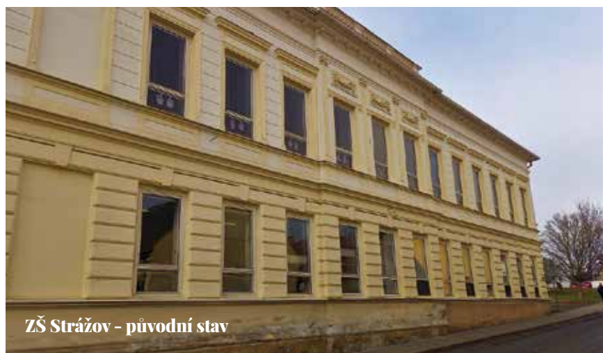
ZŠ Strážov - původní stav

Sto milionů korun pro bezmála tři stovky projektů – to je Program stabilizace a obnovy venkova 2023 v číslech. Ve srovnání s ostatními kraji jde o čísla rekordní. Co se za nimi skrývá? Každá vesnice má jinou potřebu, stálicemi ovšem jsou rekonstrukce základních a mateřských škol, opravy silnic a chodníků, rekonstrukce obecních úřadů, hasičských zbrojnic, kulturních domů, hřbitovů a podobně. V uplynulém roce proto kraj podpořil kupříkladu výstavbu nové hasičské zbrojnice v Močera- dech, vybudování komunikace pro obytnou zónu v Rejštejně, komplexní opravu hřbitova v Krsech, rekonstrukci víceúčelového hřiště v Tlučné nebo vznik nového místa pro setkávání občanů v Prostiboři. Z Programu stabilizace a obnovy venkova jsou také spolufinancovány projekty, vytvoření či změna územního plánu obcí. Malé obce na něj mohou dostat až půl milionu, větší nanejvýš tři sta tisíc. Plzeňský kraj je v kontextu celé republiky krajem specifickým: vedle dvousettisícové plzeňské