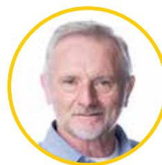
Vladimír KROC (ANO 2011) náměstek hejtmana pro oblast školství a sportu

Digitalizace přijímacího řízení usnadní rodičům i školám podávání přihlášek ke studiu. Pokud někdo elektronický přístup nechce nebo nebude moci využít, může podat přihlášku na papírovém tiskopisu jako v minulosti. Letošní zájemce o vzdělávání na středních školách však nebude tolik zajímat, jakým způsobem si podají přihlášku, ale kolik volných míst pro ně školy nabízí. Díky demografickému vývoji opouští totiž základní školy silný populační ročník a zájem o prestižní obory bude veliký. Plzeňský kraj se na to však s předstihem připravil rozšířením kapacit středních škol. Výbor pro výchovu, vzdělávání a zaměstnanost řešil během posledních dvou let žádosti středních škol o navýšení kapacit oborů nebo i vznik oborů nových, a tak volných míst pro uchazeče bude dost. Věřím, že se nakonec všichni dostanou na střední školu ke své spokojenosti.