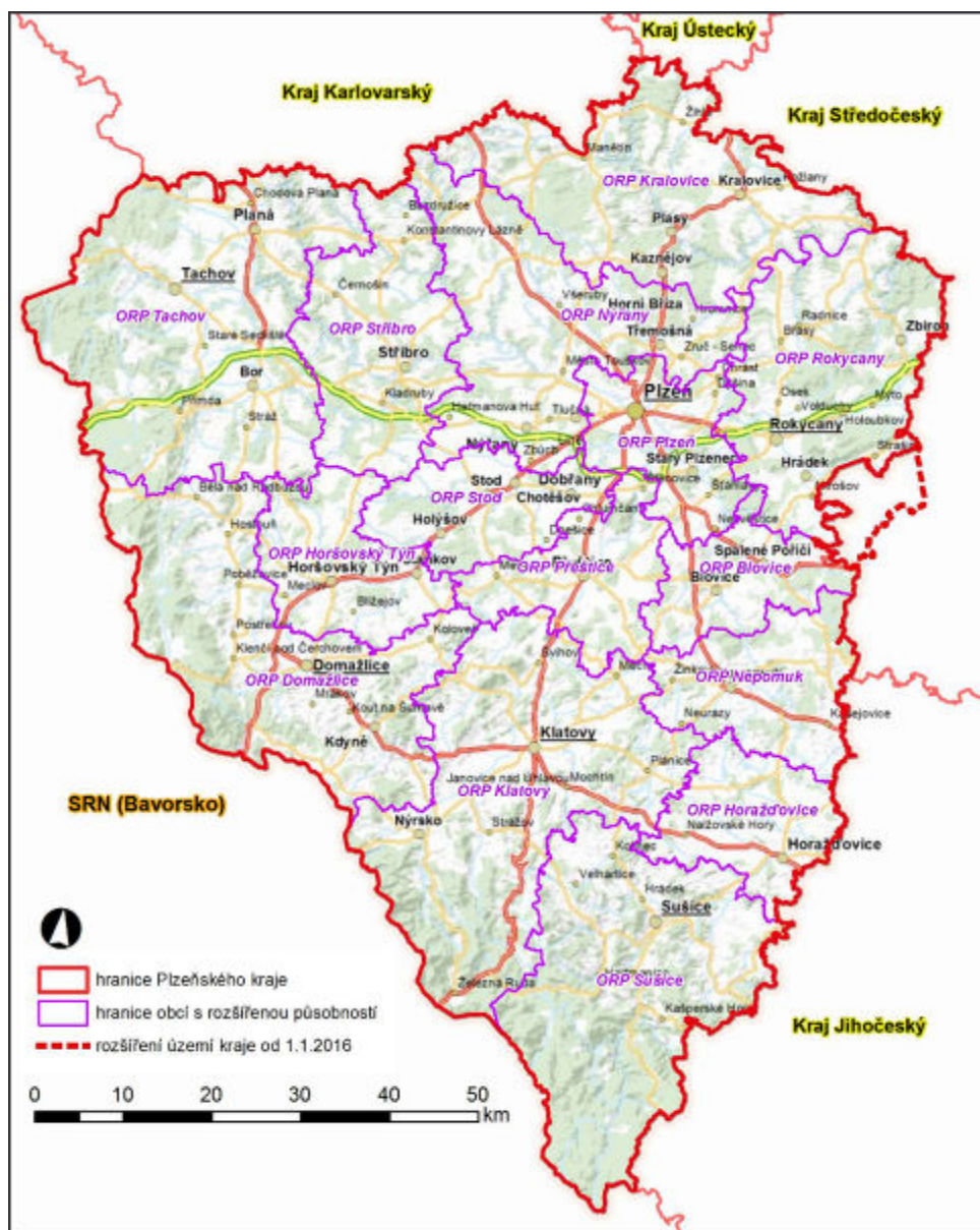
Obr. 1. Správní území Plzeňského kraje, včetně jeho členění na obce s rozšířenou působností a naznačení budoucí hranice správního území od 1.1.2016. Mapový podklad: Správní a katastrální hranice, ZABAGED - http://geoportal.cuzk.cz , http://mapy.kr-plzensky.cz .