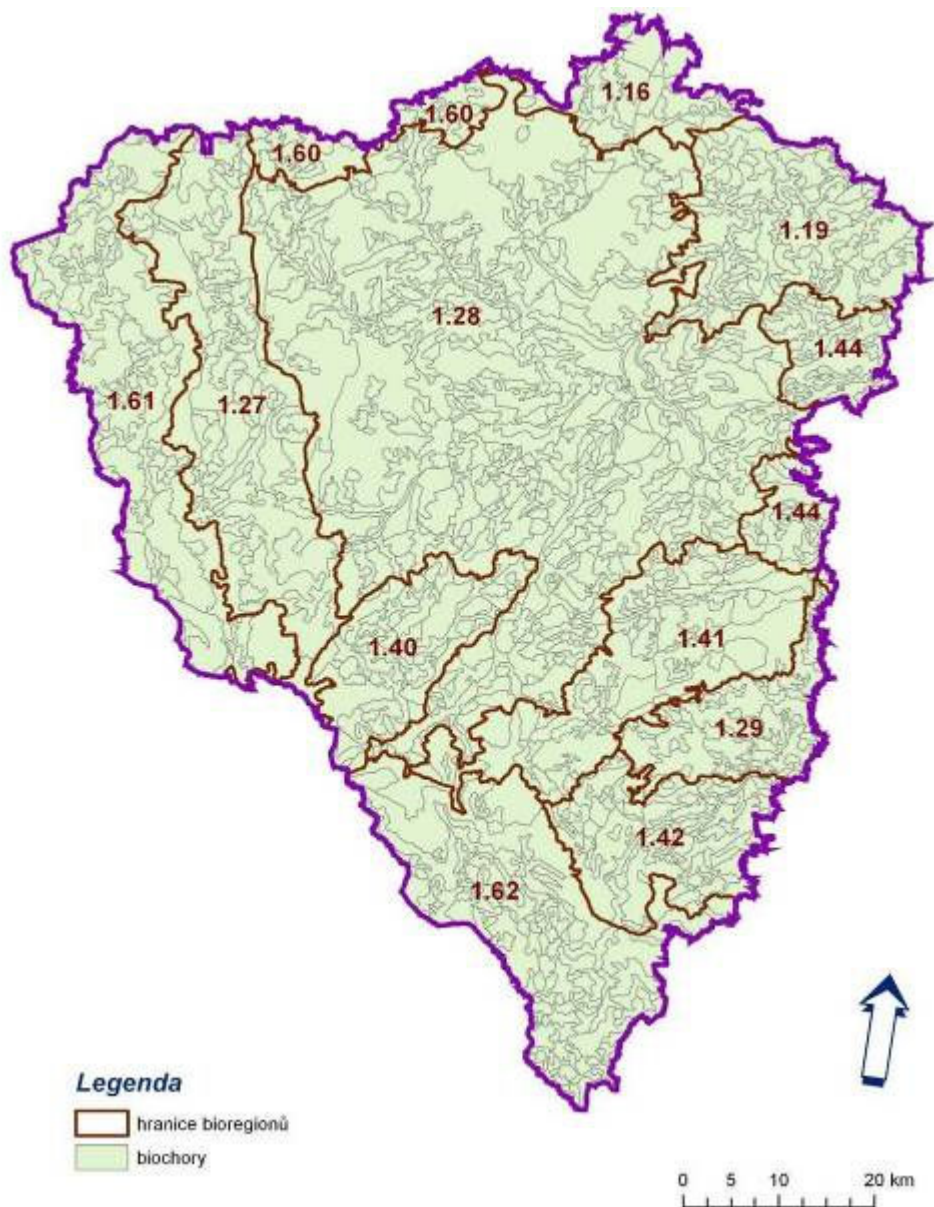
Obr. 2. Biogeografické členění Plzeňského kraje (kódy bioregionů dle Culek 1996).

na severu, k Plzeňskému bioregionu (kód 1.28). Na území kraje se dále významně uplatňují bioregiony Tachovský (1.27), Plánický (1.41), Branžovský (1.40), z horských Českoleský (1.61) a Šumavský (1.62). V severní části území kraje do něj zasahují bioregiony Rakovnicko-žlutický (1.16), Křivoklátský (1.19), v menší míře i Hornoslavkovský (1.60), ve východní části Brdský (1.44), Blatenský (1.29) a Sušický (1.42).