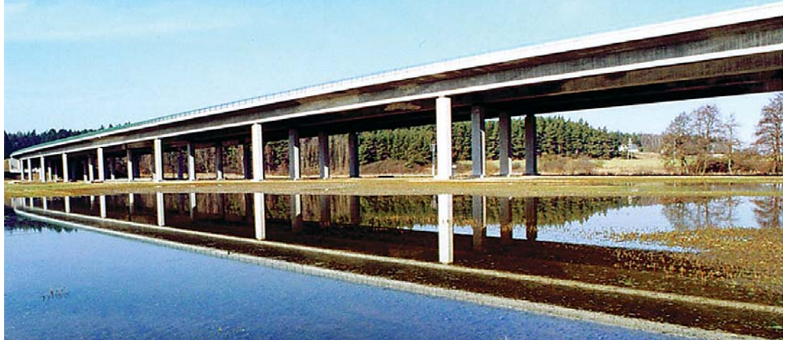
Most přes řeku Radbuza

a lesní hospodaření. Pečuje se také o maloplošná chráněná území. Nově přibývají povinnosti spojené se zaváděním chráněných území soustavy Natura 2000 podle zásad evropské legislativy. Na úseku technické ochrany byl zpracován Plán odpadového hospodářství, Program snižování emisí a Rozptylová studie PK, což jsou pilotní dokumenty v oblasti péče o ovzduší. Bohužel právě v této oblasti je legislativa dosti bezuzdná.