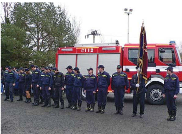
Získání nové cisterny bylo pro hasiče z Horšovského Týna slavnostní událostí.

Miliony korun na nákup nové techniky získali hasiči v roce 2005 z přebytku hospodaření Plzeňského kraje. Finanční prostředky ve výši 1 500 tisíc korun získali v Nýřanech a Horšovském Týně jako příspěvek na nákup nové automobilové stříkačkové cisterny. Těmto městům byla také poskytnuta na nákup cisteren státní dotace. Na stejné zařazení přispěl kraj jedním milionem i Blovcím. „Plzeňský kraj se tak snaží zpřístupnit obcím nákup finančně nákladných cisteren, pokud jsou jejich jednotky zařazeny ve vyšší kategorii požárního systému,“ říká náměstek hejtmána Vladislav Vilímeček. Dále poskytl kraj finance městu Zbiroh ve výši 400 tisíc korun na nákup hydraulického vyprošťovacího nářadí.