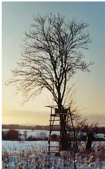
CHKÚ Český les

V uplynulých pěti letech vznikly prakticky veškeré koncepční materiály, které jsou již dnes podkladem pro tvorbu konkrétních projektů a návrhů opatření na řešení dílčích úkolů ve všech oblastech životního prostředí. Na úseku ochrany přírody byla v roce 2004 zpracována Koncepce ochrany přírody a v roce 2005 byl dokončen Generel regionálního systému územní stability Plzeňského kraje. Naprosto výjimečnou prací byla příprava podkladů pro vyhlášení CHKÚ Český les v roce 2005. Návrh byl zpracován tak, aby území Českého lesa nebylo jen statickou výkladní skříní zachovalé přírody, ale aby tu mohl probíhat i praktický život a podpora především šetrného turistického ruchu a zemědělské