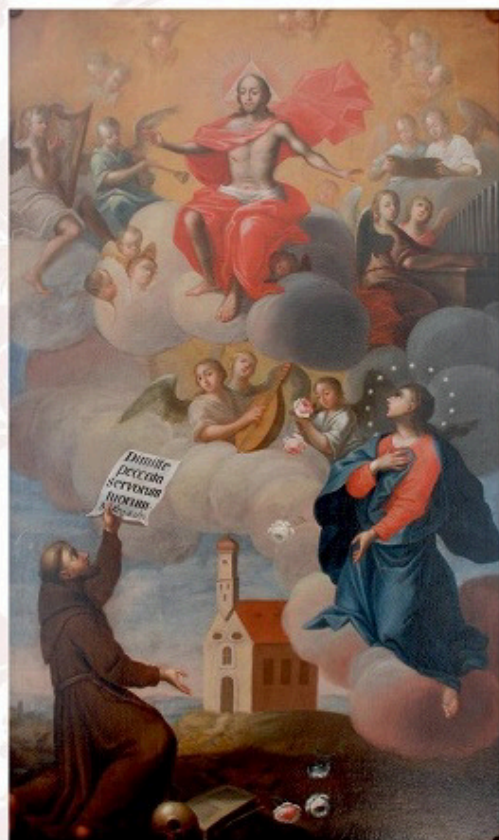
Eliáš Dollhopf, Odevzdání kostela v Kristovu ochranu, muzeum v Tachově